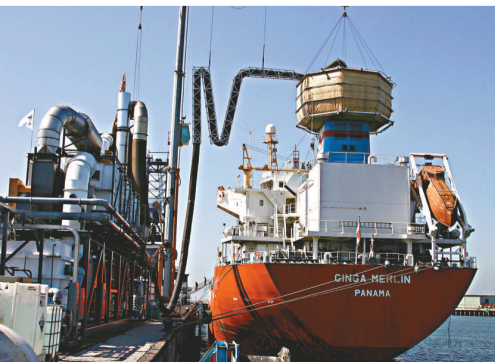
▲加州長灘港委託一家高級清理技術公司，對靠岸化工品船實施減碳排放措施，是用這種重2500磅「金鐘罩」方式，套在船煙囪上收集有毒污染物，保持港區環境與空氣

由2015年開始，在較敏感的地區，例如波羅的海、北海和英倫海峽，限制燃料的硫排放量由1.5%降至0.1%。在2020年開始，規定其他地區的硫排放量由4.5%降至0.5%。預計整個方案將耗資340億歐元。他們預算新的機制對整個船運業的影響介乎26至110億歐元，相對於目前用以維持公共保健系統的340億歐元是微不足道；又指貨船可以採用「相關科技」，例如廢氣處理系統，去取代使用低硫燃料。