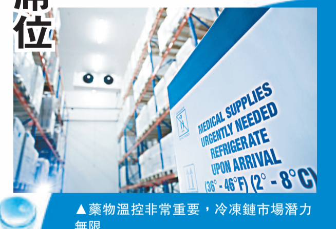
▲藥物溫控非常重要，冷凍鏈市場潛力無限

但隨着醫藥產品逐漸增多，市場亦越趨複雜。這個正逐步細分的全球市場，正受到來自不同當局的百變要求，及對產品溫控範圍的監管所支配，可以肯定的是，只有那些願意投資及了解藥業物流的承運商才能在市場上佔一席位。