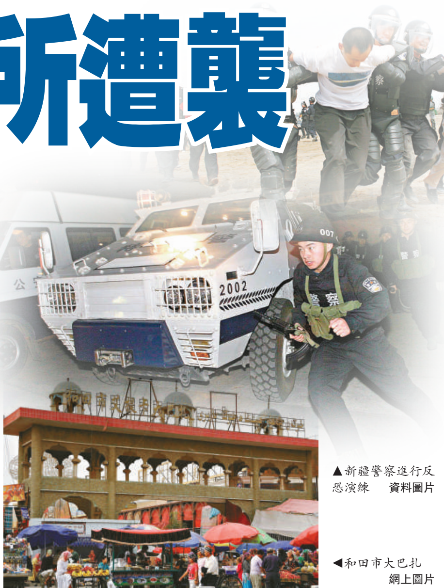
▲新疆警察進行反恐演練