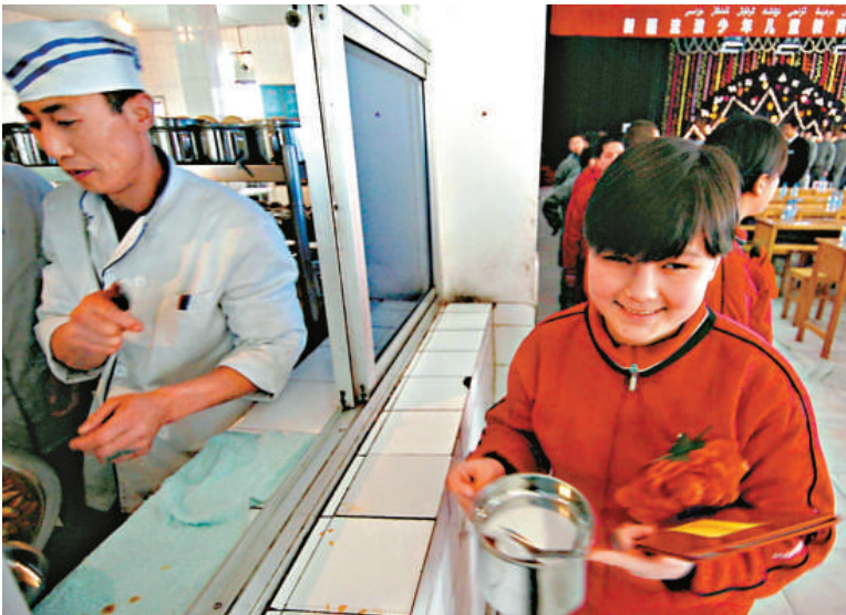
▲受到救助的新疆兒童在食堂打飯，他們在流浪少年兒童教育救助中心生活一年，接受文化教育和心理輔導

【本報訊】據新華社烏魯木齊十八日消息：自今年四月提出接回內地新疆籍流浪兒童至今，新疆已陸續從全國各地接回一百九十一人。