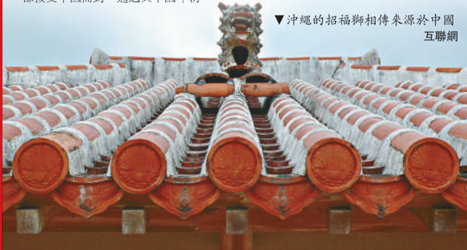
▼沖繩的招福獅相傳來源於中國 互聯網

資料記載，琉球被日本吞併之前，正殿二樓會掛有九面中國皇帝賜給琉球王的御筆匾額，幾經戰火，現在已經不知去向。沖繩的「國寶」，是一座懸掛「守禮之邦」匾額的牌坊，稱為「守禮門」。它就聳立在首裡城公園的大門外，也就是宮殿的入口處。守禮門的原型是中國的牌坊，掛上「守禮之邦」漢字匾額。