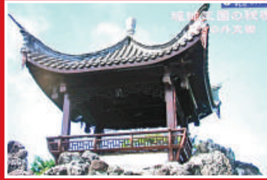
▲中國後裔的居住區裡還有中國式的庭院和假山

►2010年12月17日，日本首相菅直人到訪沖繩縣政府時，當地居民示威抗議 資料圖片