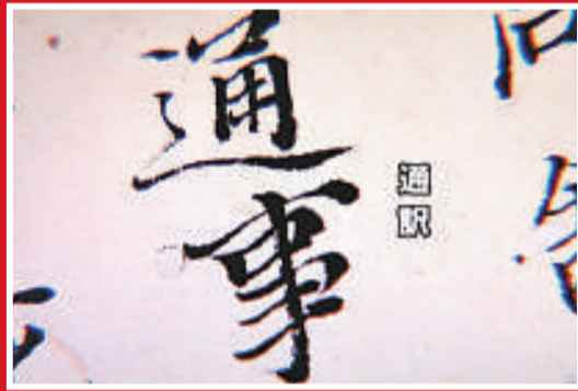
▲梁嵩的子孫被朝廷派往琉球國擔任通事（翻譯）