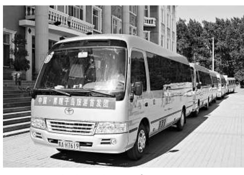
▲黑瞎子島旅遊首發團車隊啟動

【本報記者于海江黑龍江富錦18日電】備受期待的中國黑瞎子島首個旅遊團18日早從哈爾濱出發，預計19日傍晚抵達黑瞎子島所在地撫遠縣，隨後登島遊覽。