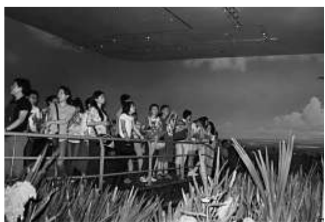
▲旅行團在三江平原濕地宣教館參觀

據旅行社工作人員介紹，黑瞎子島旅行線路全長812公里，費用約為850元（人民幣），全程4天3夜。目前島上暫不具備住宿條件，僅可用餐。該線路由黑龍江省國際旅行社有限公司（簡稱黑龍江省國旅）獨家經營，在撫遠設立日常運營機構，統一經營登島旅遊項目。暫時只對團體遊客開放，散客不