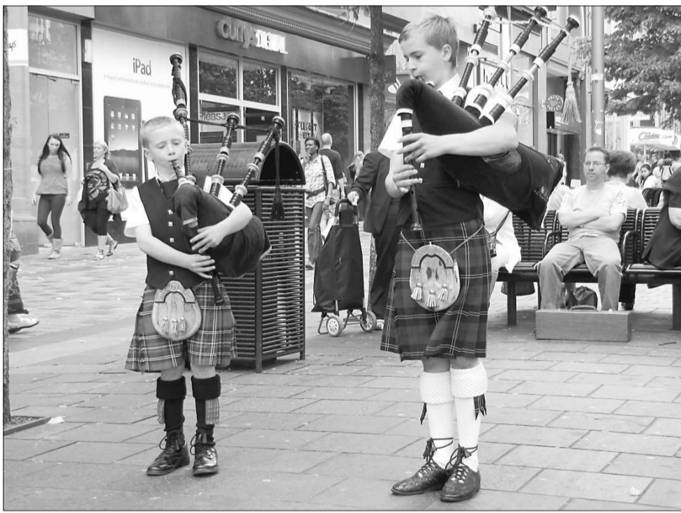
蘇格蘭小風笛手

這個服裝禁令比打敗仗更令蘇格蘭人心痛，它等於剝奪了高地人的民族身份，深深傷害了他們的民族自尊。這場戰爭給高地文化帶來毀滅性打擊，「吉爾