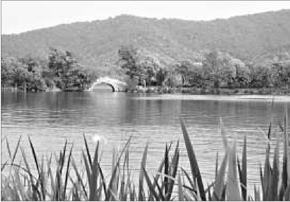
湘湖秀色