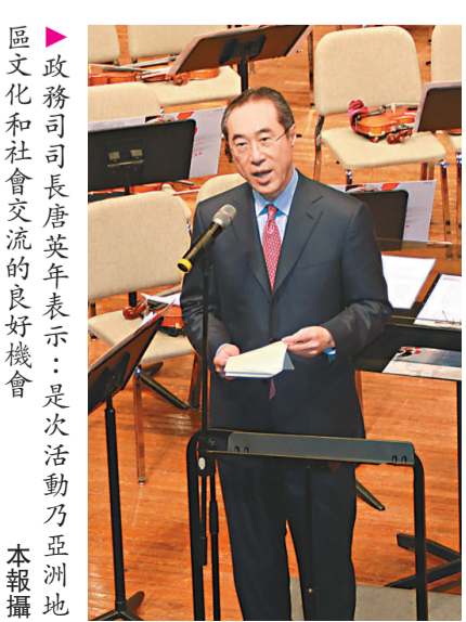
▲亞洲青年管弦樂團創辦人及藝術總監龐信