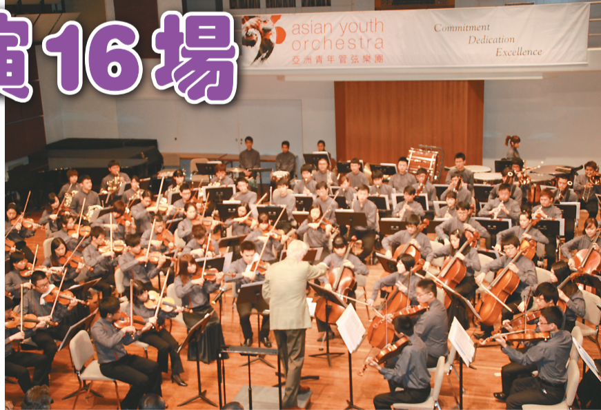
▲排練營開幕傳統：樂團演奏艾爾加的《謎語變奏曲：狩獵者》