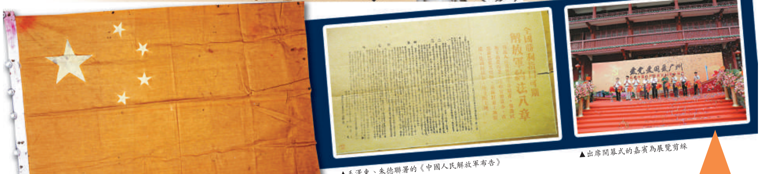
▲毛澤東、朱德聯署的《中國人民解放軍布告》