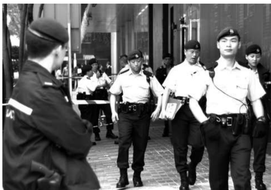
◀外泄的警隊訓練教材涉及警方處理突發事件的部署 資料圖片

立法會保安事務委員會主席涂謹申認為，有關文件是技術性資料，如果有人預先知道其內容，可能會令部署失效。但他相信，互聯網上已有外國的相關資料。他