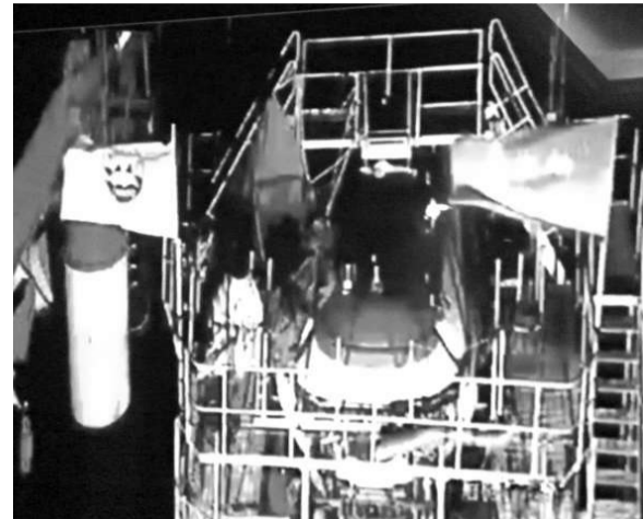
▲ 22 日從海洋局大屏幕上拍攝的在東太平洋母船上進行下潛準備的「蛟龍」號

據報，此次 5000 米海試「蛟龍號」總共將下潛大約 4 次，共有 6 名潛航員執行下潛任務，其中有 3 人曾經下潛過 3000 米海底。按試驗計劃，每次將有 3 名潛航員下水，6 人將輪番衝擊 5000 米深度紀錄，將開展海底照相、攝像、海底地形地貌測量、海洋環境參數測量、海底定點取樣等作業的試驗與應用。