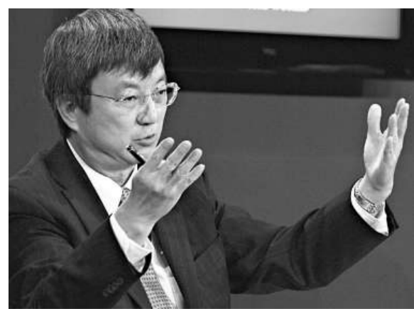
▲ 人民幣匯率一直是中國與 IMF 關係中的「敏感字眼」，也是朱民擔任國際貨幣基金組織副總裁後不能迴避的重要議題

不過，IMF 強調，人民幣大幅升值不會讓美國和歐洲成為大贏家。據 IMF 計算，人民幣升值 20% 將使美國經濟成長率提高 0.05 到 0.07%，對歐元區經濟成長率的提高不到 0.12%。IMF 建議，中國應採用人民幣升值來緩解通脹以及房地產泡沫等風險，因為人民幣升值可幫助降低油價、食品價格和其他進口產品的價格。報告稱，僅靠現行匯率機制，可能僅可在因應全球經濟失衡方面發揮溫和作用。但是人民幣被低估阻礙了中國內部的經濟再平衡進程。