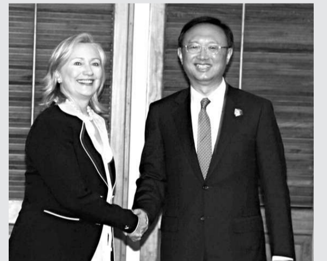
▲ 中國外長楊潔篪（右）在印尼峇里島會見美國國務卿希拉里·克林頓，雙方就兩國關心的問題進行友好的交談