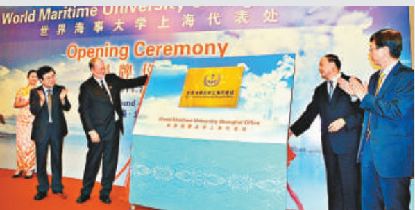
世界海事大學上海代表處在北外灘揭牌

截至2010年底，集聚在北外灘的各類航運要素單位已達3044家，此番世界海事大學上海代表處的落戶，是上海國際航運中心軟環境建設的重要進步，亦成為上海發展知識型高端航運業務的重要舉措。