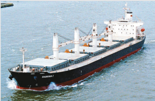
▲巴拿馬型散貨船在亞洲市場露一絲曙光

日本3月發生地震和海嘯，令國內生產嚴重受損，對燃料產品需求亦大減。日本以另類燃料替代核能發電的計劃告吹，為保證有足夠發電量，必須採用傳統發電燃料，但仍不足以彌補國內煉油業所失的市場。