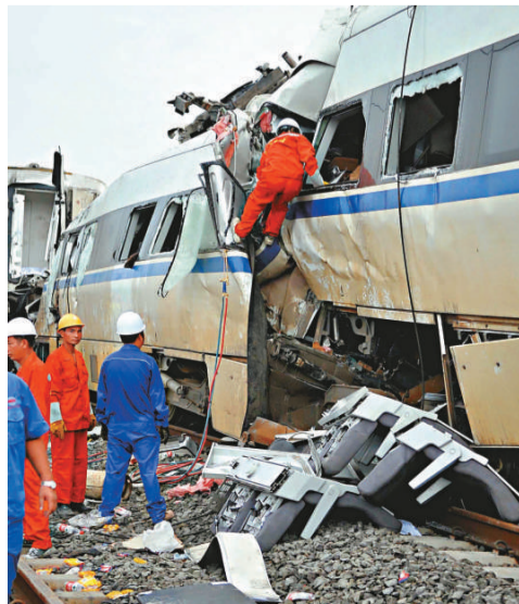
▲救援人員和施工人員在清理事故現場

【本報訊】中新社杭州二十四日消息：記者今天從浙江保監局獲悉，7·23溫州動車追尾事故後，浙江保監局立即啓動重大突發事件應急預案，建立以局領導為負責人的應急指揮部，第一時間下發文件要求各家保險公司積極做好理賠工作。目前，相關的理賠工作正在積極推進之中。同時，鐵道部也就脫軌事故道歉，承諾按規定賠償。