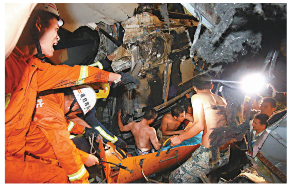
▲鐵路部門及地方有關單位已緊急組織救援

據事故現場記者證實，上海鐵路局長因溫州動車追尾事故被就地免職。據現場消息，脫軌原因是動車遭到雷擊後失去動力停車，造成追尾。但也有業內人士分析認為，除了自控系統故障外，追尾的第二個原因，可能是調度出了問題。據悉中國鐵路客戶服務中心網站的列車時刻表顯示，在台州至溫州南段，應該是D301列車在前，D3115在後。但現實卻是相反的。 【本報記者楊楠上海二十四日電】