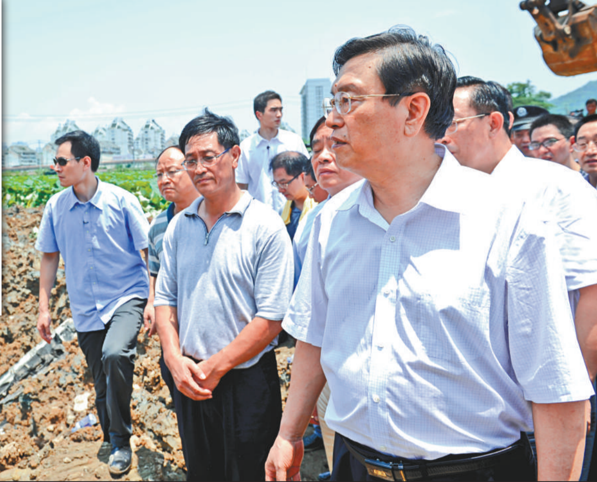
▲24日，受胡錦濤總書記、溫家寶總理委派，中共中央政治局委員、國務院副總理張德江率有關部門負責同志趕赴溫州，指導事故救援、善後處理和事故調查工作

23日晚上20時34分，杭深線永嘉至溫州南間，北京南至福州D301次列車與杭州至福州南D3115次列車發生追尾事故。D301次列車第1至4節脫軌，D3115次列車第15、16節脫軌，其中4節車廂墜落橋下。