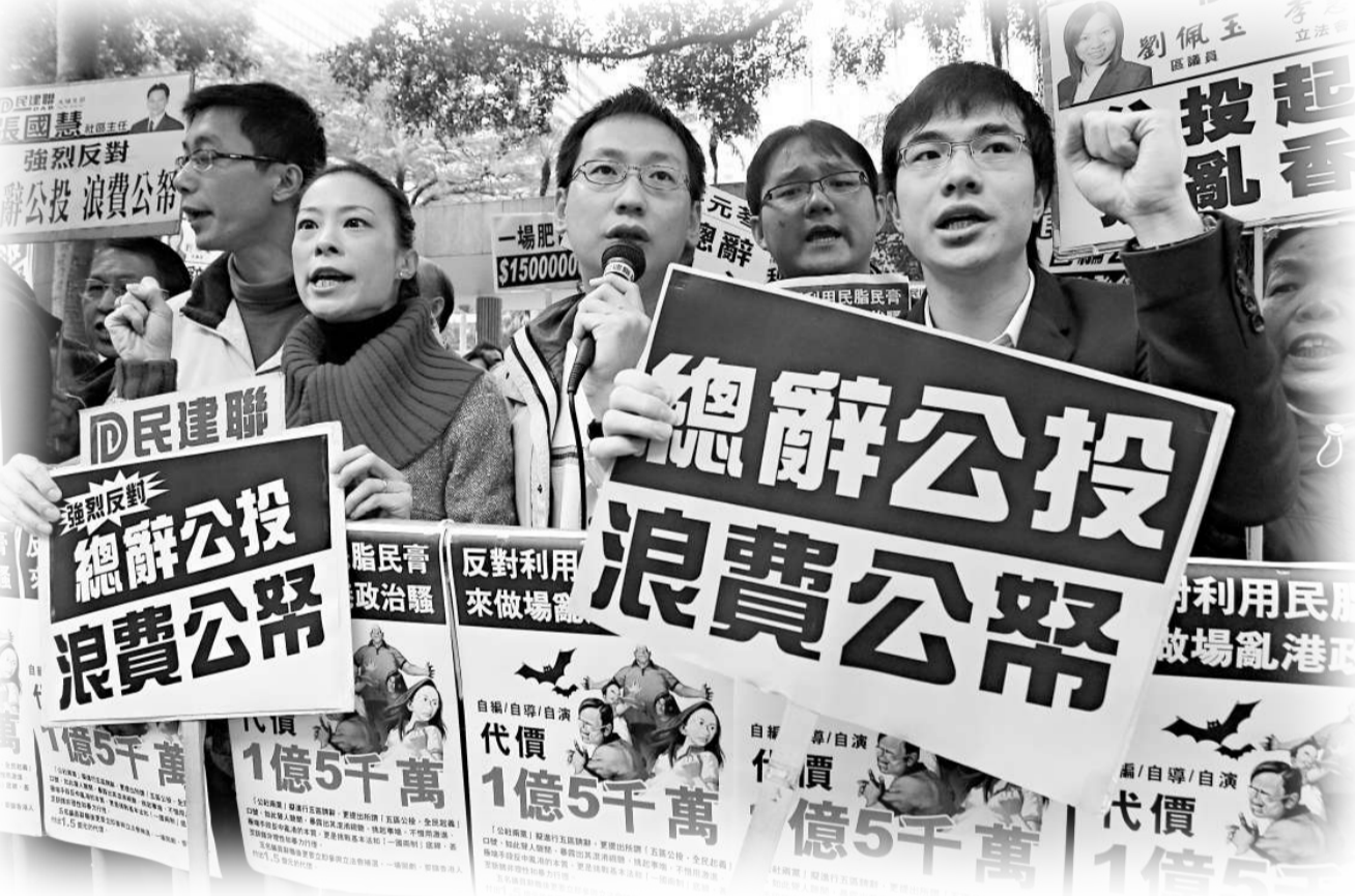
▲市民普遍要求政府堵塞漏洞，以杜絕議員任意辭職再參與補選的事件重演

補機制進行公眾諮詢，只是對目前的方案仍存在了解程度不高的問題，因此促請政府對諮詢加強宣傳力度，如透過媒體、諮詢會等形式，向公眾闡釋方案內容，以提高市民對不同方案的認知度。