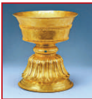
酥油燈 1757-1777年 金，鑲嵌綠松石 高33厘米 拉薩布達拉宮管理處藏