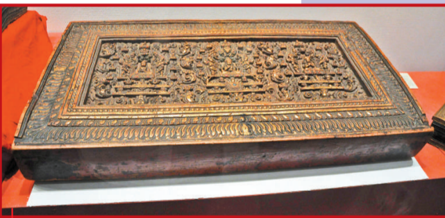
●藏文《八千頌般若波羅密多經》 十五世紀前半 藍紙金書，經夾板木質雕刻 縱54、橫101厘米 日喀則江孜白居寺藏