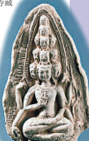
●十一面觀音菩薩擦擦 「擦擦」指脫模製作的小型泥塑佛像和佛塔。 十三至十四世紀 陶 高11厘米 西藏博物館藏