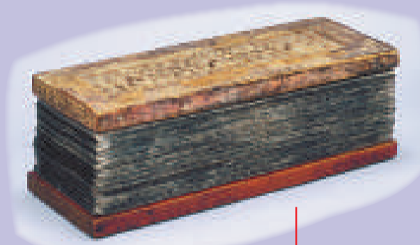
●《丹珠爾》 十八世紀 藍紙金書 縱20、橫70.3厘米 拉薩布達拉宮管理處藏