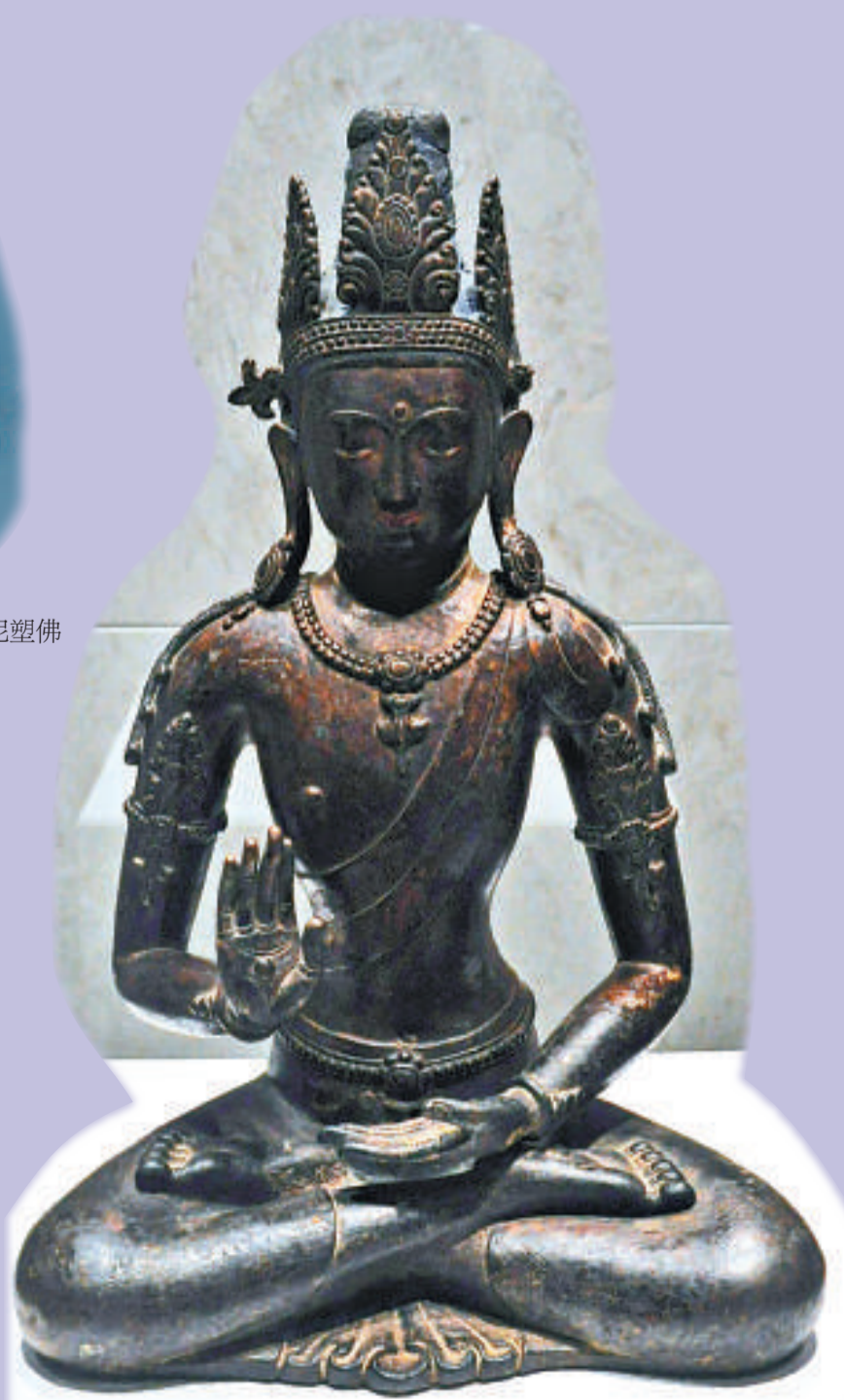
●不空成就如來佛 十一世紀 鑲金銅，局部泥金彩繪 高45厘米 西藏博物館藏