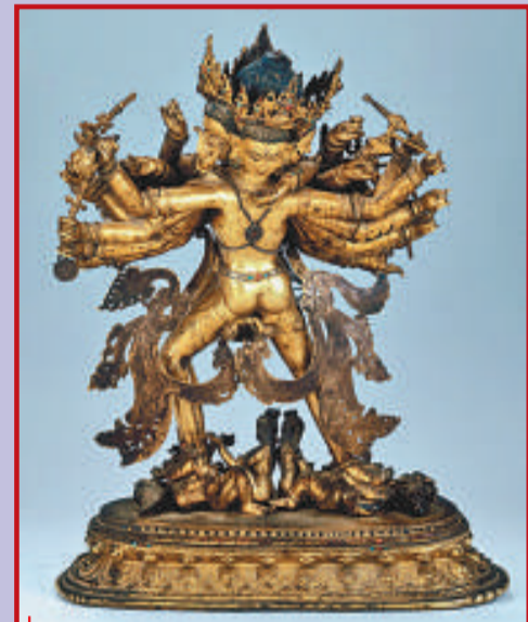
●時輪金剛雙身像 十四世紀 銅鑲金 局部泥金彩繪 鑲嵌綠松石、珊瑚、寶石 高59.5厘米 四藏日喀則夏魯寺藏