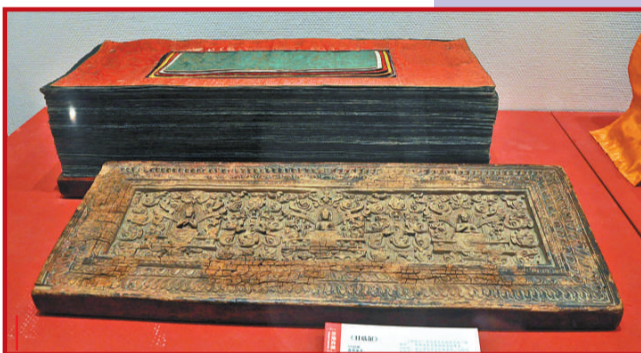
●《甘珠爾》 1725年 藍紙金書，經夾板木質金彩雕刻 縱29、橫74厘米 日喀則薩迦寺藏

《四部醫典》將佛法的修持融於藥理之中，所以《四部醫典》的唐卡上，都繪有大醫王——藥師佛，佛教無疑已滲入西藏文化的每個角落。