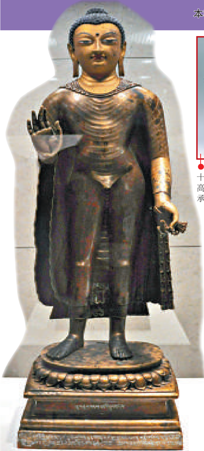
●佛立像 七世紀前半 銅鑲金，局部泥金彩繪，鑲嵌銀、紅銅 高94厘米 拉薩布達拉宮管理處藏