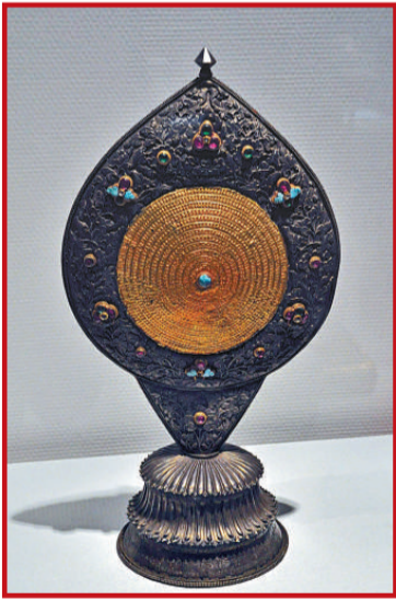
●法輪 清代（1644-1911）銀，局部鑲金，鑲嵌綠松石、寶石 高47厘米 西藏博物館藏