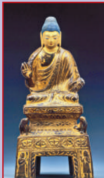
●八思巴像 十三至十四世紀 玉，局部泥金彩繪、銅鑲金、鑲嵌綠松石、寶石、珍珠 高55.7厘米 拉薩布達拉宮管理處藏