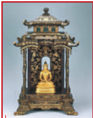
●髹漆描金重檐四角形佛龕 十八世紀 木，黑漆描金 高76.4厘米 承德市外八廟管理處