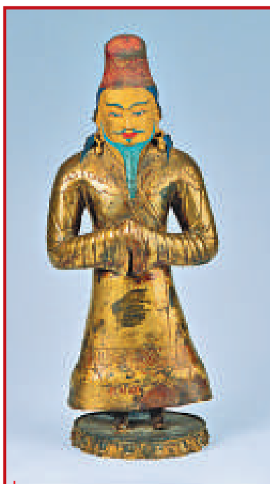
●祿東贊像 十三至十四世紀 銅鑲金，局部泥金彩繪 高29.5厘米 拉薩布達拉宮管理處藏