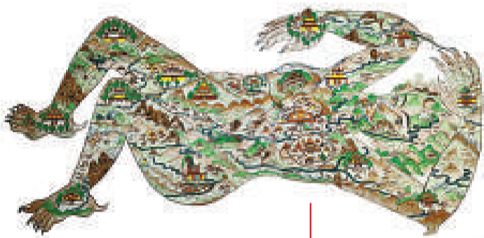
●魔女仰臥圖 二十世紀 紙本彩繪 縱77.5、橫152.5厘米 拉薩羅布林卡藏