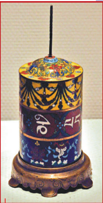
●轉經筒 十八至十九世紀 招絲法琅 高22.6厘米 西藏博物館藏