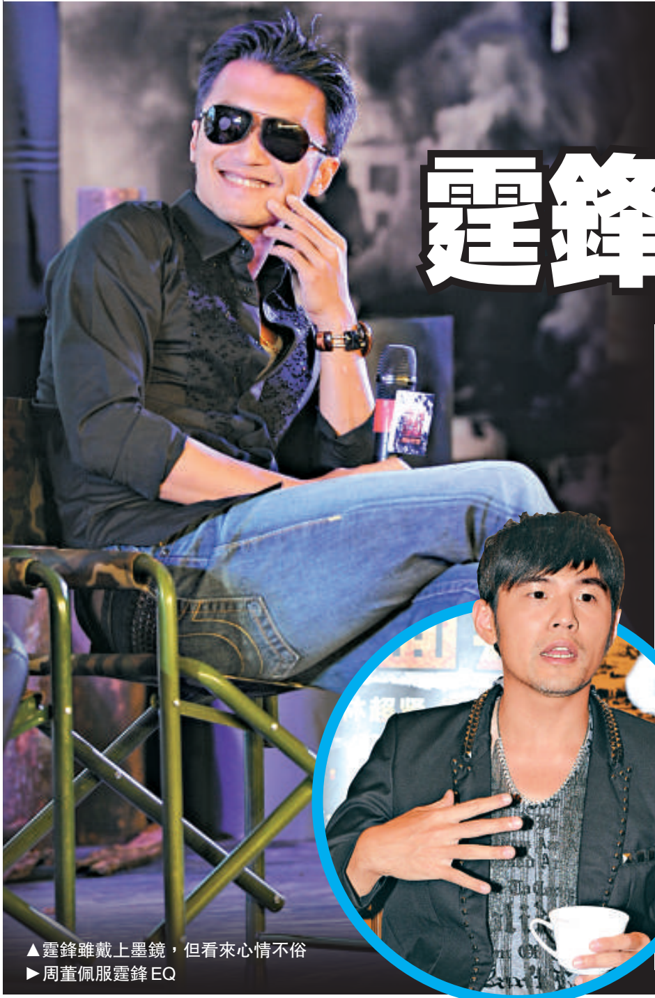
▲霆鋒雖戴上墨鏡，但看來心情不俗 ▶周董佩服霆鋒EQ