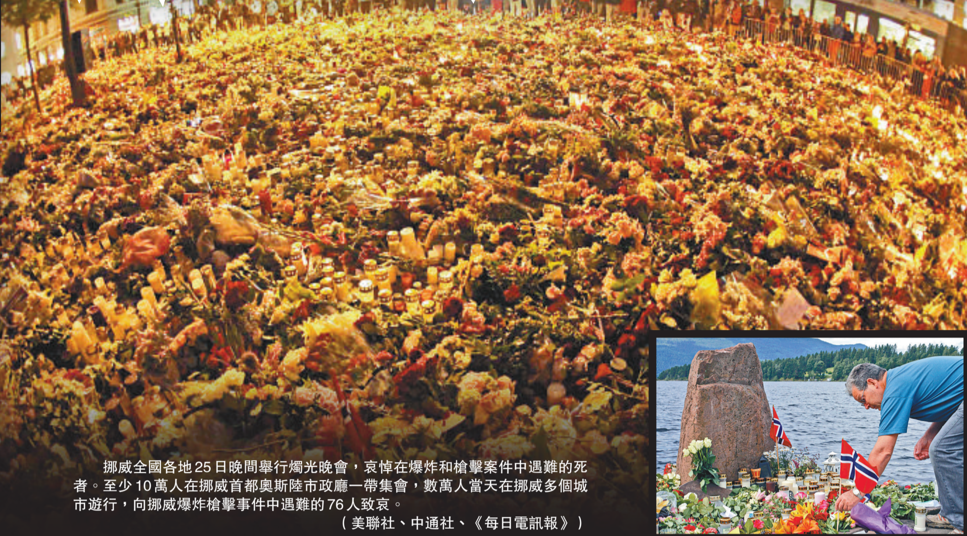
挪威全國各地25日晚間舉行燭光晚會，哀悼在爆炸和槍擊事件中遇難的死者。至少10萬人在挪威首都奧斯陸市政廳一帶集會，數萬人當天在挪威多個城市遊行，向挪威爆炸槍擊事件中遇難的76人致哀。 (美聯社、中通社、《每日電訊報》)