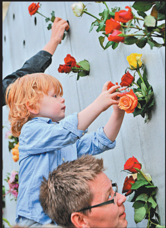
▲一名兒童將玫瑰繫到紀念遇難者的牆上 ▲奧斯陸大教堂外擺滿鮮花和蠟燭，為遇難者祈福