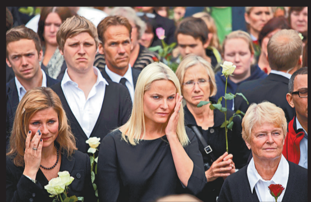
▲挪威儲妃梅特·馬里特（中）25日在奧斯陸市政廳參加悼念儀式

兇手與英右翼組織來往甚密 【本報記者黃念斯倫敦二十六日電】雖然英國極右組織「保衛英國聯盟」(EDL)否認與挪威連環襲擊殺手布雷維克有任何關係，但EDL內部人士向英媒透露，布雷維克去年曾到英國參加EDL示威活動，還經常與EDL成員在網上聯絡，對EDL造成的影響甚大。 布雷維克發表在網上的宣言說，他在社交網絡Facebook經常跟600名EDL成員聯絡。他寫道：「我在Facebook有600名EDL朋友，並經常跟他們的成員和負責人對話。」他還稱：「事實上，從一開始我便是向他們(EDL)提供意見主張(包括措詞策略)的人之一。」 除了透露9年前他在倫敦秘密結社，有一名英國導師、兩名同夥之外，布雷維克還在宣言裡23次提及與英國主張排外的政黨「英國民族黨」的關係。 雖然EDL方面一再否認跟布雷維克有任何關係，但在2010年負責組織EDL示威的達爾·霍伯森對《每日電訊報》證實，布雷維克去年到英國探訪向極右政治人物格爾茲、懷爾達斯，並參加了EDL的示威活動。 達爾·霍伯森說：「布雷維克大約有150名EDL成員名單，他的確在2010年來參加過我們的示威。」另一位匿名EDL成員也承認，布雷維克確在Facebook跟該組織成員聯絡，而且對EDL起着「感化」作用。 「我跟他Facebook對過幾次話，他相當聰明，有表達才能，親切友善。他是那種很能影響別人的人，我相信EDL的人會很欣賞他。」該EDL匿名者並稱，布雷維克從2009年起在Facebook跟他們聯繫，並跟該組織的幾名成員相熟。EDL領頭人斯蒂芬·倫農25日對英國廣播公司表示，他不相信布雷維克出席過EDL的示威。