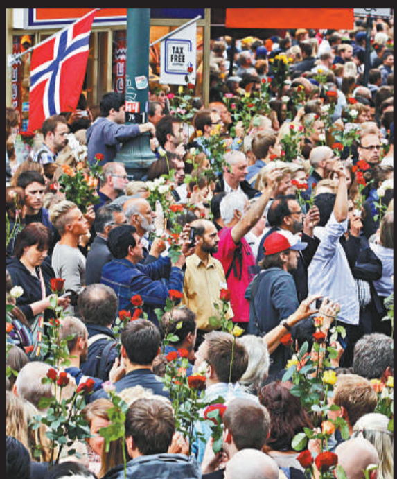
▲挪威民眾手持玫瑰在奧斯陸集會，哀悼遇難者