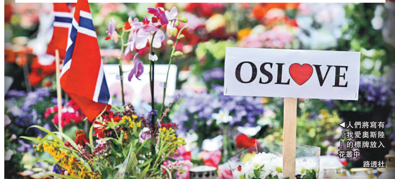
▲人們將寫有「我愛奧斯陸」的標牌放入花叢中

相當痛苦。無論如何，我已經被牽涉進來，因為我是他父親，但我希望大家知道我真的無能為力。我的下半輩子都要活在恥辱當中，人們會一直把我和他聯繫起來。」他還表示，對他兒子的兇殘行為感到「極度恐懼和震驚」。 老布雷維克在接受電視採訪的時候反覆重申，他的兒子應自行了斷。他說：「這是他唯一該做的，自殺謝罪。我再也不會跟他有任何聯繫，我仍無法理解，這種事情怎麼可能發生，任何正常人都不會這麼做。」 25日早些時候，老布雷維克和他現任妻子、布雷維克的繼母汪達在法國的住所被警員搜查。不過當地警方表示，之所以有警員看護該住所，是為了預防意外事件以及維持公共秩序。 老布雷維克與挪威殺手布雷維克的生母在布雷維克1歲的時候離異，他在法國時曾要求獲兒子的監護權，但以失敗告終。在布雷維克16歲以後就與他斷絕了聯繫。老布雷維克說，只有在兒子童年時父子兩人才有些接觸，他小時候是個普通的男孩，不是很愛說話。自己直到上網看新聞時，看到兒子的姓名和照片，才知道兒子犯下大案，他感到很震驚。