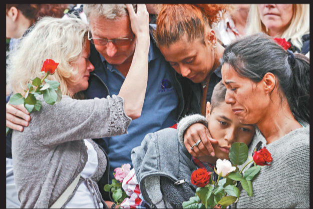
▲參加悼念儀式的民眾互相安慰