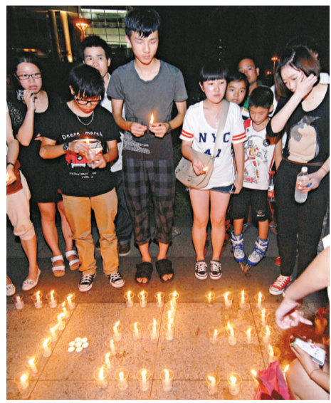
▲溫州市民自發為事故遇難者默哀

大災面前，總有人性讓我們感動。溫州人用行动告訴我們，他們不只會做生意，關鍵時刻他們還無私、團結：事故現場附近的居民第一時間自發參與救援，「富二代」用豪華義運送傷者家屬，出租司機免費接