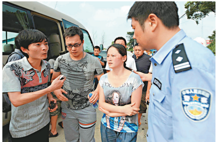
▲一位警察帶著幾位遇難者親屬到事故現場

據中國網報導，國家安全生產監督管理總局原定於26日在溫州就「甬溫線鐵路交通事故」召開現場分析會，但由於在溫州「坐鎮」的鐵道部主要官員臨時返回北京向國務院作事故情況報告，該現場分析會被延期至27日舉行，具體時間地點未定。不過，新華社消息稱，鐵道部有關人士介紹，國務院已專門成立了「7·23」