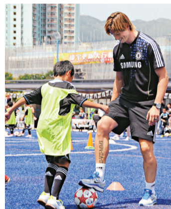
▲費蘭度托利斯（右）耐心指導小朋友

不過，費托昨在射門表演中卻未能數糊，射門被客串把關的沙洛文卡勞悉數救出，且看他今天能否攻破傑志大門。