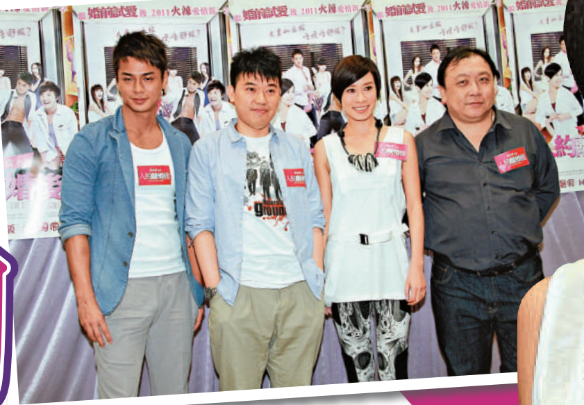
▲阿余擬入戲院看新片反應