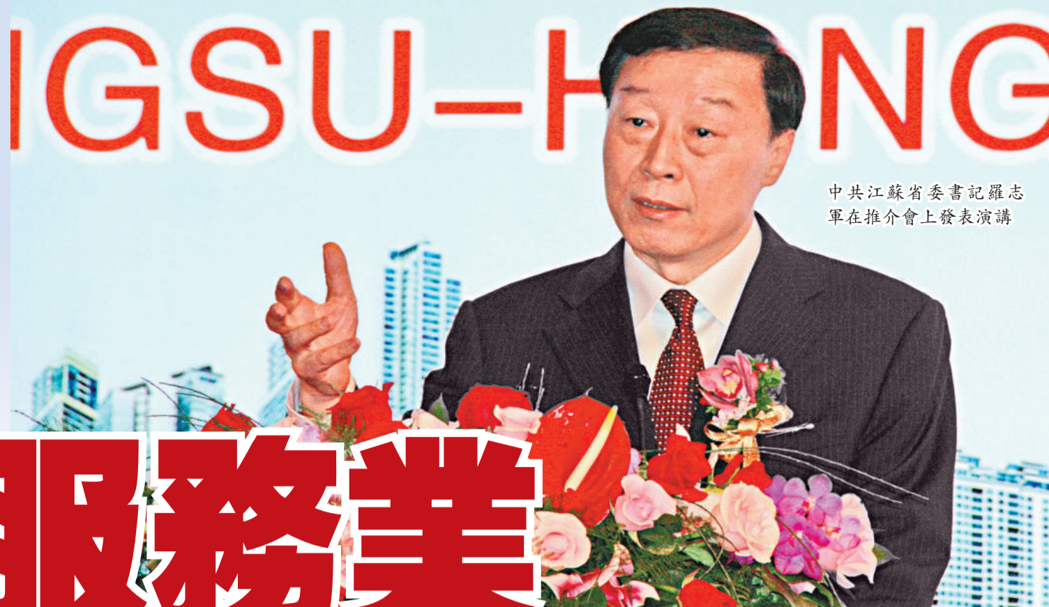
中共江蘇省委書記羅志軍在推介會上發表演講