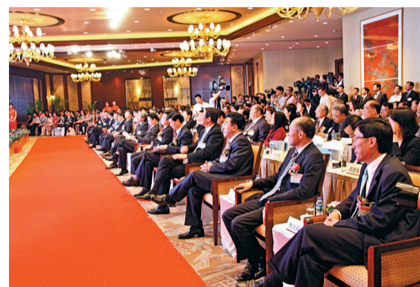
推介會現場冠蓋雲集

發展的機會。特別是透過CEPA框架,香港服務業業者可在44個領域赴江蘇投資,相信通過此次推介會,一定會進一步促進港人赴江蘇投資服務業。