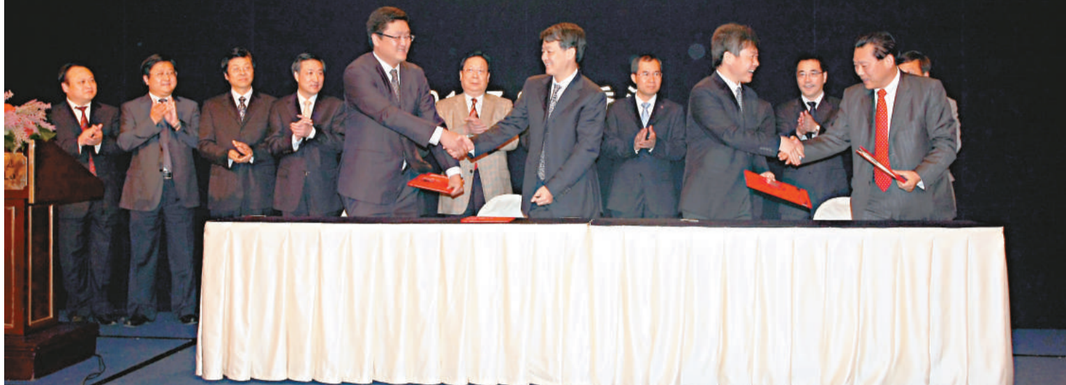
▲南通來港推介多個重大項目

【本報訊】江蘇省南通市來港推介其沿海開發等重點項目，推出一百零六個重大項目，昨日與本港簽約額達到二十八點三億元，主要涉及沿海大型石化、網絡電子商務平台等項目。南通市委書記丁大衛表示，南通市十分重視與港合作，截至去年底，南通與香港的進出額達到七億美元。