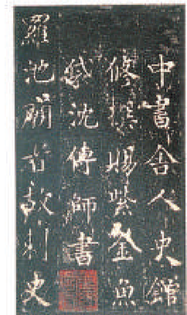
宋拓孤本《柳州羅池廟碑》（三井聽冰閣藏）