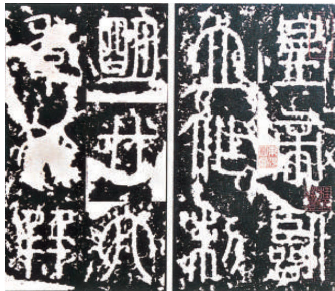
宋拓《泰山刻石》165字本（日本書道博物館藏）