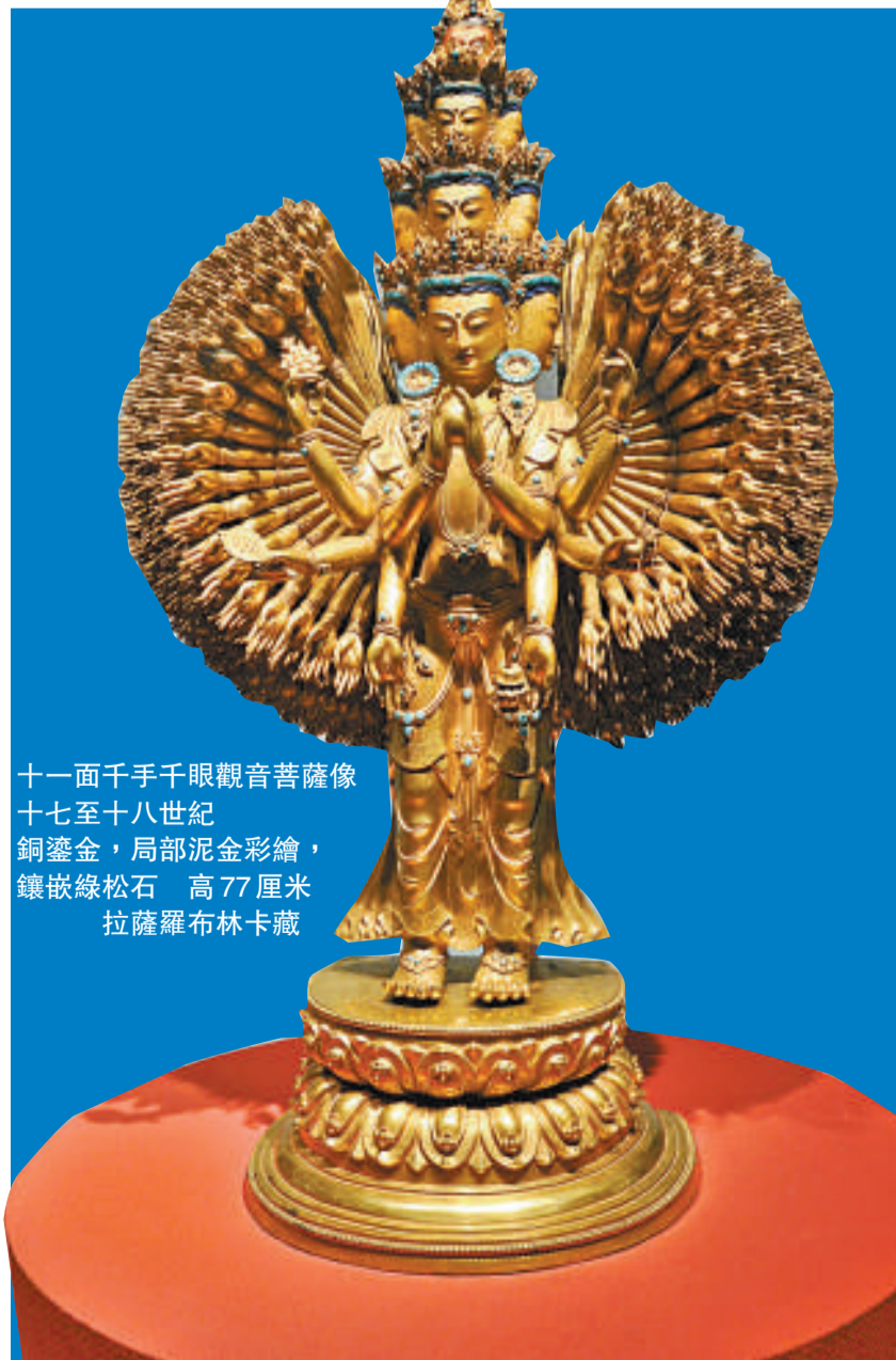
十一面千手千眼觀音菩薩像 十七至十八世紀 銅鑲金，局部泥金彩繪，鑲嵌綠松石 高77厘米 拉薩羅布林卡藏