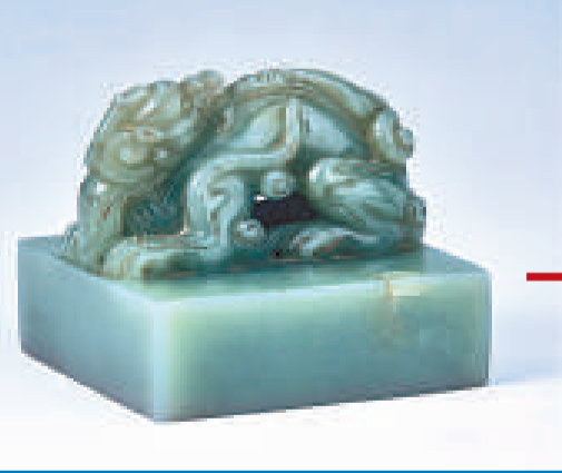
桑傑帝師印 十四世紀 玉高8、長寬各8.7厘米 西藏博物館藏