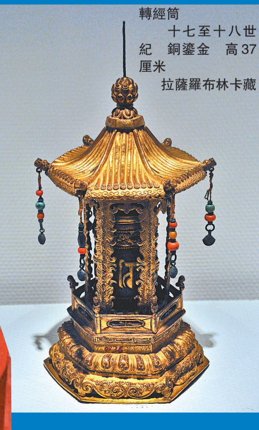
轉經筒 十七至十八世紀 銅鑲金 高37厘米 拉薩羅布林卡藏