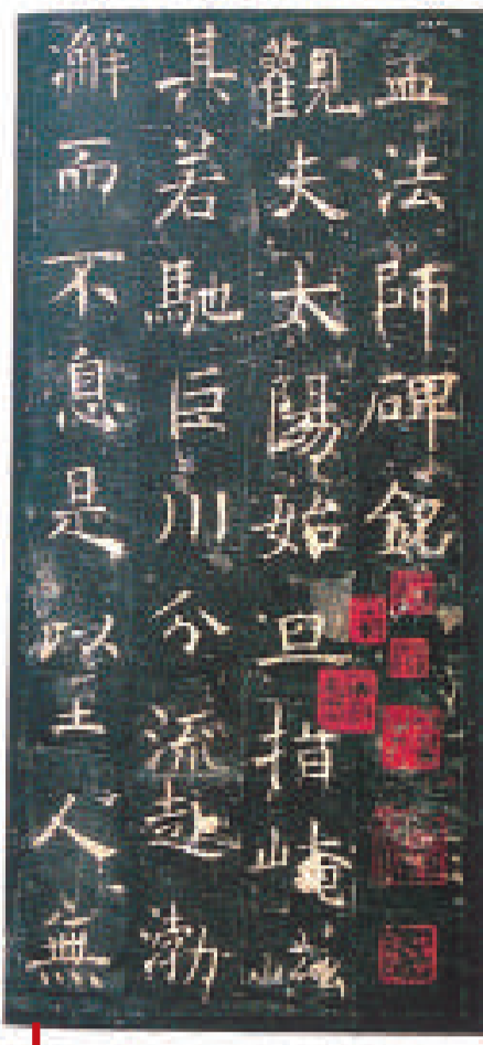
唐拓《孟法師碑》孤本（三井聽冰閣藏）

三井家聽冰閣收藏的善本碑帖，很多是經過當時在三井家做書法顧問的書法篆刻家河井荃蓋鑒定後購買的。河井荃蓋（1871—1945年），號荃廬，也用過蟬巢、九節文人等名號，室名寶書齋、繼述堂等。他最初隨條田芥津學習篆刻，後多次來中國，崇仰吳昌碩，被譽為「日本現代篆刻之父」。他學識淵博，對印譜、古文獻、碑帖的研究有很高的造詣，後被三井高堅邀請做顧問，他們經常在一起研討碑帖，在聽冰閣的徵集目錄中經常可以見到河井荃蓋的名字。三井高堅的私印及聽冰閣的鑒藏印有「聽冰堂藏」「聽冰閣所藏」「三井家聽冰閣監藏」「聽冰閣」「三井家聽冰閣」「聽冰閣藏」「聽冰閣藏金石文字」等。