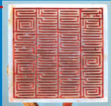
屍陀林主服飾 二十世紀 棉布、竹 高180厘米 拉薩布達拉宮管理處藏