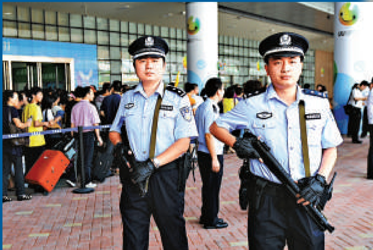
▲八月一日，深圳邊檢反恐突擊隊員開始配槍巡邏

目前，自大運安保開始以來，深圳警方已查獲數萬把管制刀具、仿真槍支。同時，一些港人北上尋歡常去的向西村、水圍等地因遭警方排查，已少見港人蹤影。