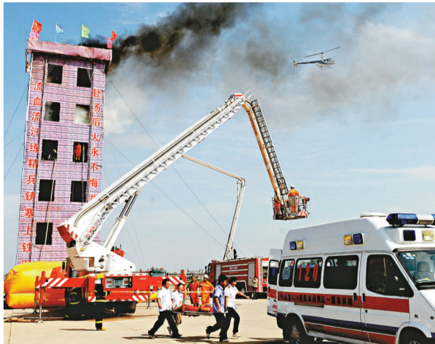
▲八月一日，陝西省榆林消防支隊舉行實戰演練，邀請數千名市民現場觀摩，了解消防官兵滅火救援、綜合保障等多方面技能

自7月24日開始，中國鐵路已全面開展了安全生產大檢查，集中力量，舉一反三，排查和整改安全生產的突出問題，消除隱患，特別是重點加強高鐵路信號系統安全管理，提高系統安全防護能力，穩定安全生產局面。