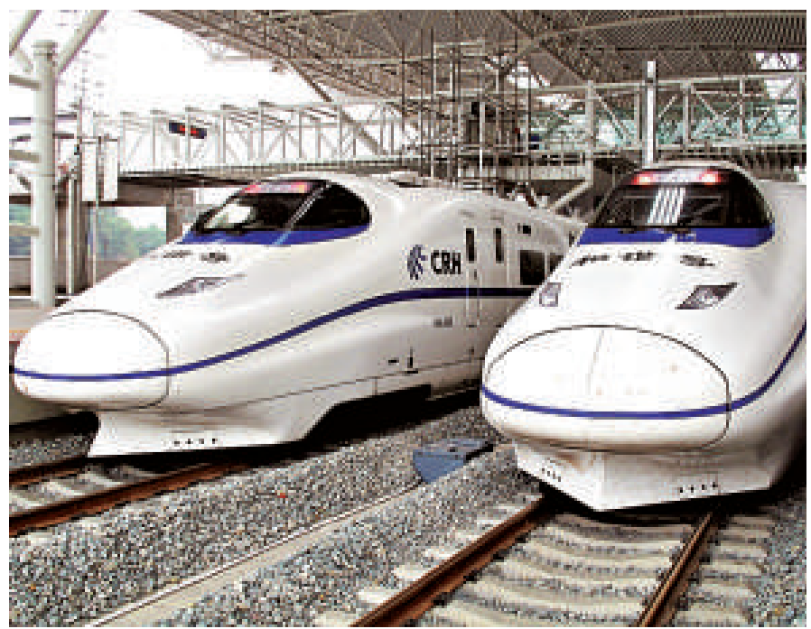
▲近期，動車、高鐵不時出現延誤

但亦有網友對這樣的討論表示淡定——「我還是會選擇動車，現在坐的人少，只有更舒服。畢竟故障、晚點等事故率還是小」。