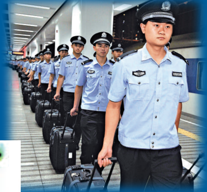
▲來自全國各地院校的二萬名學警抵達深圳協助大運會安保

深圳大運會進入倒計時10天，海陸空安保全面升級。公安部治安管理局今日宣布啓動100個環粵環深公安檢查站等級查控，管控公路、鐵路、水路、空路進粵入深通道，嚴防危險物品。同時，湖南、廣西、福建、海南和江西等環粵5省區警方將共築「護城河」，全面防控共保「平安大運」。