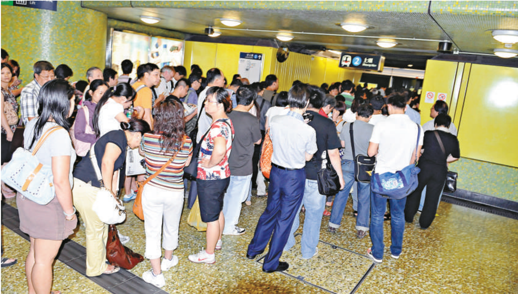
▲港鐵港島線列車在繁忙時間跳電，月台人頭擠擁的情況比平日嚴重幾倍

另昨午十二時四十分，東鐵線一班開往羅湖的列車在行駛途中，有乘客發現車卡冒煙大驚通知車長，車長將事件報告控制中心，在確定未有即時危險下按照指示，將列車駛進最近的大圍車站月台，將全部乘客疏散轉乘下一班列車後，隨即將列車駛返車廠接受檢查，事件中無人受傷。據港鐵發言人表示，初步檢查發現列車其中一卡的冷氣電線損毀短路冒煙，事件中受影響乘客約五百人，列車服務影響輕微，公司暫未接獲有關事故的投訴。