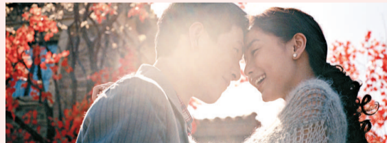
▲井柏然和 Angelababy 非常登對