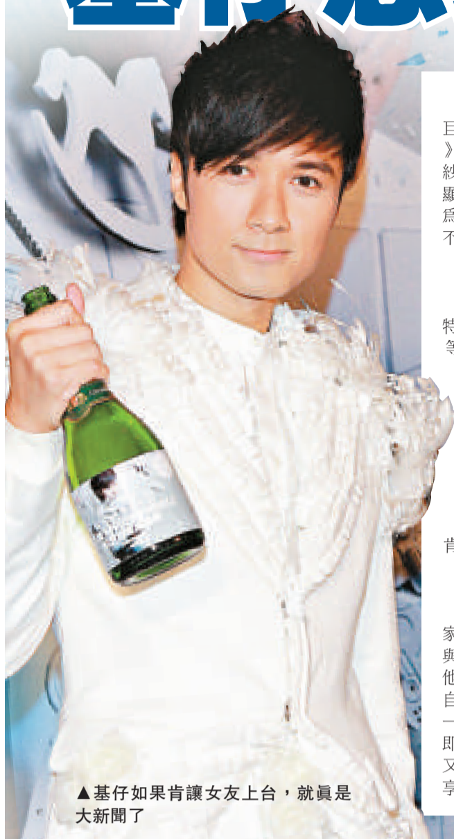
▲基仔如果肯讓女友上台，就真是大新聞了

古巨基昨為 10 月 7 日至 9 日在紅館舉行的《古巨基 Amazing World 世界巡迴演唱會 2011 香港站》舉行記者會，大會請來七位外籍女模特兒穿着婚紗亮相，不過眾女模向基仔送吻時，他卻一臉尷尬顯出無福消受的樣子。基仔透露今次會以主題樂園為演出概念，屆時他更會與七位公主談情說愛，亦不介意被吻七次。