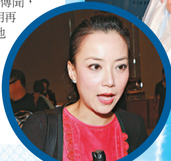
▲基仔笑言不敢做現代章小寶 ▲Mani 對露鋒很放心