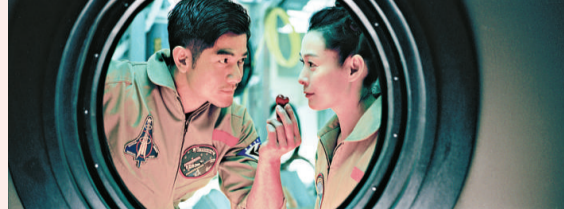
▲城城指劉若英很有意思

《全球熱戀》於香港推出一款主海報，而中國內地亦趁 7 月 7 日的中國情人節七夕，發布兩款七夕版海報。除主海報之外，更特別發布了由導演演夏永康親自掌鏡拍攝的「私家情侶照」。