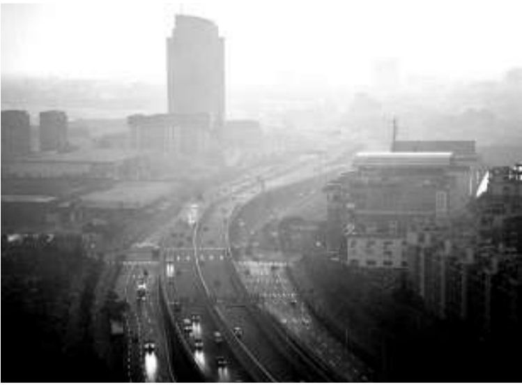
◀上海連日雷雨頻頻，午間突如同黑夜，只是「梅超風」的序曲

為防禦「梅花」，滬鐵將嚴格執行防洪行政首長負責制，要求工務、電務等基層單位主要領導，從6日起24小時輪流