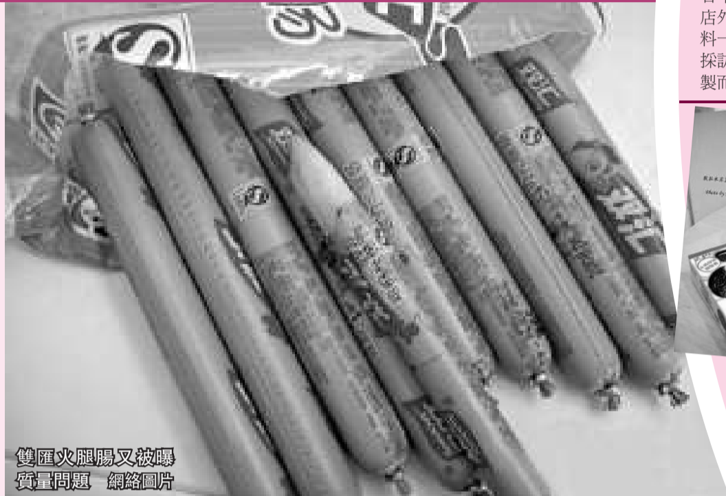
雙匯火腿腸又被曝質量問題 網絡圖片

消費者對號稱用豬骨熬製的味千拉麵湯底的質疑接踵而至，對此，味千中國總部投資者關係部負責人不得不承認，味千的湯底確實並非現場熬製，濃縮液是由豬骨熬成的。濃縮液送至門店後，由門店的工作人員通過加水和一些其他佐料「還原」成湯。