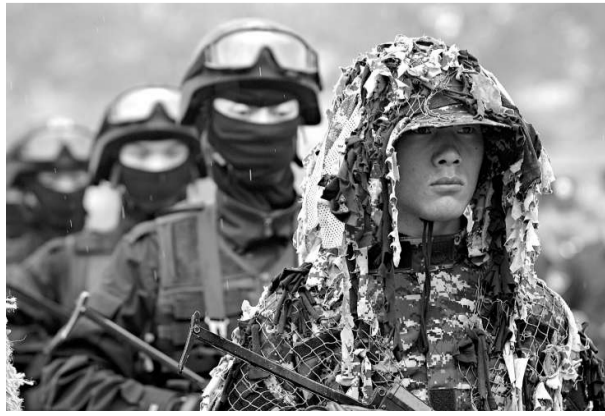
▲4日，西安市公安局特警支隊的特警隊員參加「夏季練兵」匯報演練

在喀什市人民西路，越來越多的轎車、摩托車、公共汽車、行人出現在街頭，大量的摩托車停在環疆爾買城門前。