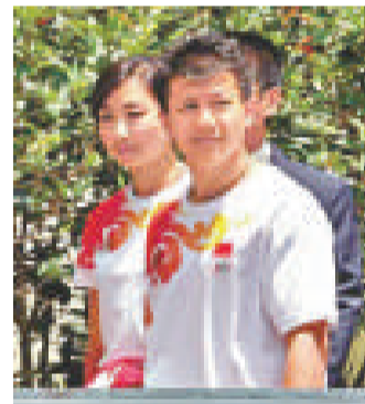
▲陳一冰(右)早已與何雯娜分手

此前在接受採訪時，陳一冰就曾表示，二人之間的感情，由於女方的性格原因已出現「危機」。在今天的博文中，陳一冰稱何雯娜「是個好女孩」。同時他表示，感謝對方三年多來的陪伴，