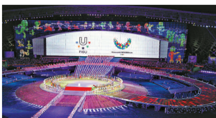
▲大運會開幕式凸顯青春、知識、體育、環保和中國元素