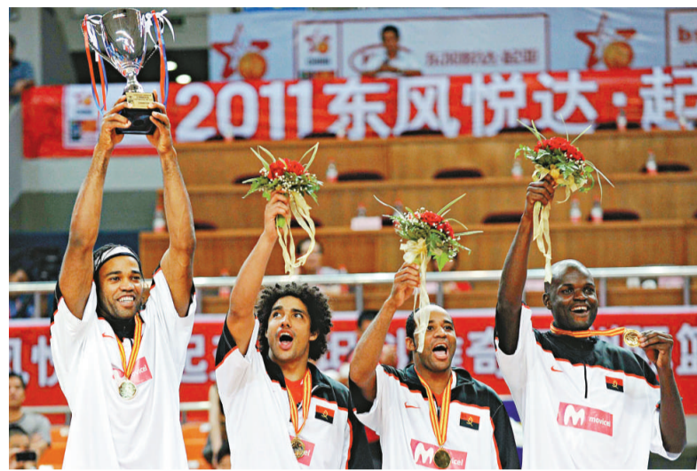
▲安哥拉7年內第二次奪斯杯冠軍，圖為球員在領獎台上慶祝

緊接上演的決賽，安哥拉首節以24：8大幅拋離澳洲，第4節接連外線命中一度領先超過30分，澳洲力追下仍以19分差距輸波，安哥拉7年內第二次捧起斯杯。斯坦科維奇杯明日移師到廣州舉行廣州站比賽。