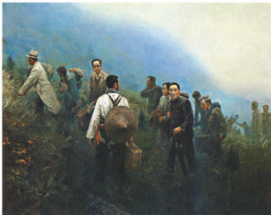
「紅色歷程·風雲畫卷——廣州藝術博物院藏革命歷史題材美術作品展」正在廣州舉行，廣州藝術博物院從豐富的院藏作品中精選了油畫、國畫、版畫、雕塑、剪紙等不同門類的革命歷史題材美術作品近五十件，回顧中國共產黨九十年來走過的紅色歷程，同時回顧新中國美術發展的歷程。