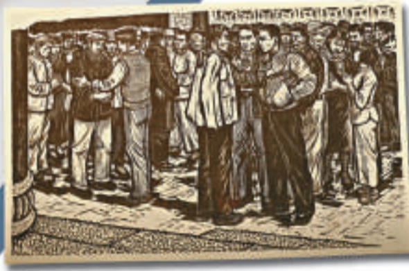
▲楊納維的版畫《紅花崗起義》（組畫，其中之一），上世紀五十年代