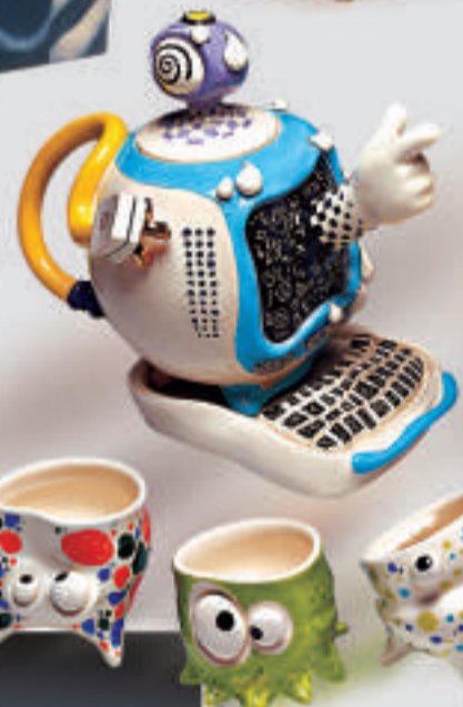
▲馬佩婷作品，二〇〇七年