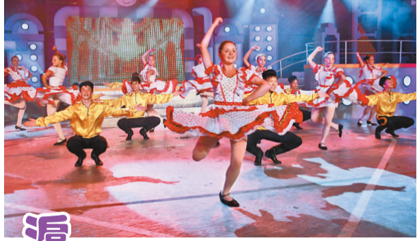
來自世界各地的十二個少兒藝術團體為藝術節閉幕晚會獻藝

【本報訊】記者余正妮上海報導：二〇一一年上海國際少年兒童文化藝術節圓滿落下帷幕。作為享譽國際的少兒文化品牌，第六屆上海國際少年兒童文化藝術節於今年七月三十日至八月五日在滬舉行。來自世界十七個國家和地區的四十八個兒童藝術團體，共一千九百多名小演員歡聚一堂。