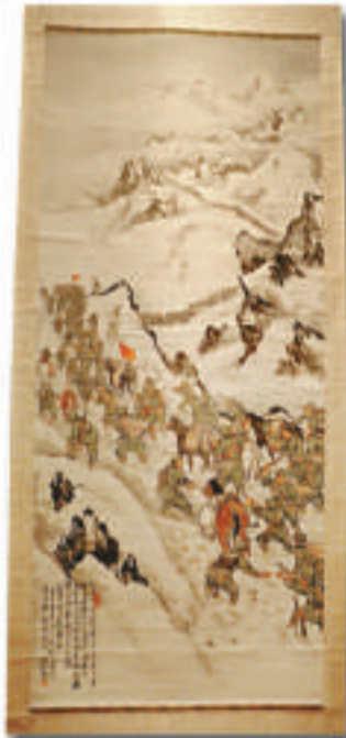
▲月、林之耀合作《陳毅吟詩》（賴少其、師松齡、陶天關山月《長征圖》，一九五一年