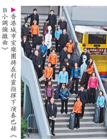
香港城市室樂團將在利靈指揮下演奏巴赫《B小調彌撒曲》

利靈是世界著名研究巴赫的學者，亦是指揮家及教育家，一九三三年出生於德國斯圖加特一個音樂世家。八月中，香港樂迷可目睹他的風采。他將首次來港，透過一系列講座及演出，解構巴赫的《B小調彌撒曲》。八月十七日晚上八時，利靈將在大堂音樂廳指揮香港城市室樂團演奏《B小調彌撒曲》，參與表演的有Die Konzertisten 合唱團、客席合唱團青協香港旋律，以及女高音葉葆菁、女中音鄭勵齡、男高音譚天樂