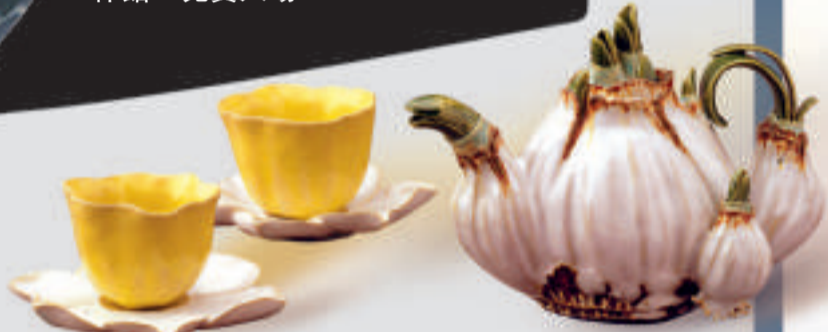
▲成翹湘作品，一九八九年