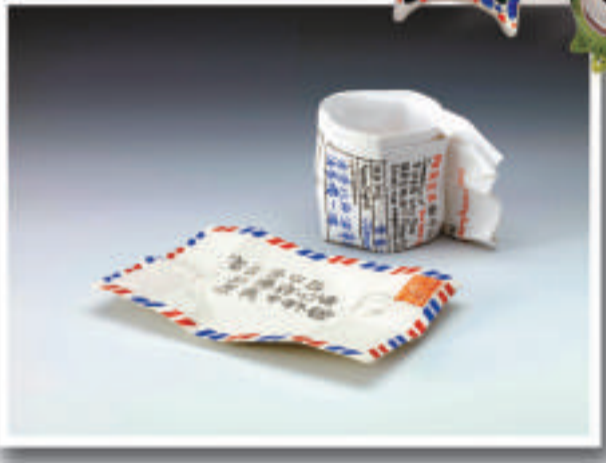
▲曾章成作品，二〇一〇年