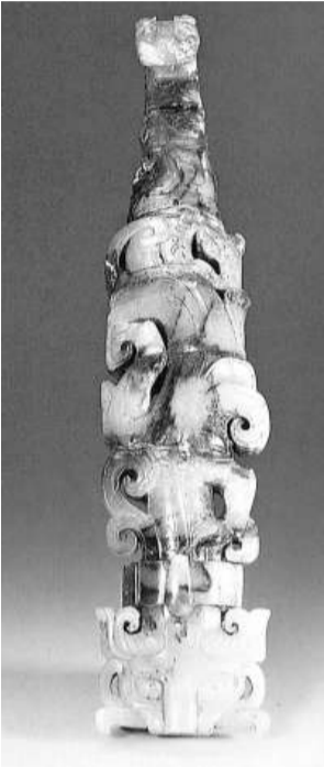
西漢龍虎首玉帶鉤

西漢玉器，如劍飾、帶鉤、璧、環、瑗、玦、蹀形佩、葬玉(如哈蟬、握鈎)、舞人、角形杯和玉衣等，縱使不是白玉，而是青玉，玉質也溫潤堅結、精光內蘊。造型、紋飾及線條千變萬化，極富藝術美。打磨拋光、鏤空(透雕)、穿孔等俱一絲不苟。線刻(包括陰刻)、浮雕和雙面雕鏤空，琢刻工藝精湛，多姿多彩，使人目不暇給。像附圖的青玉龍首虎首併體帶鉤，就是西漢(公元前時期)南越王墓出土的精品之一，帶天然褐沁，值得欣賞。