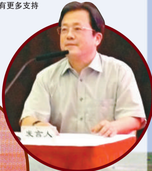
▲馮遠認為應加強內地與港澳民間組織的文化交流