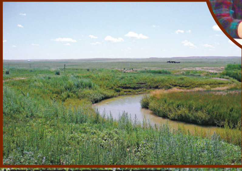
▲草原文化的重點在於對草原生態的保護與培育