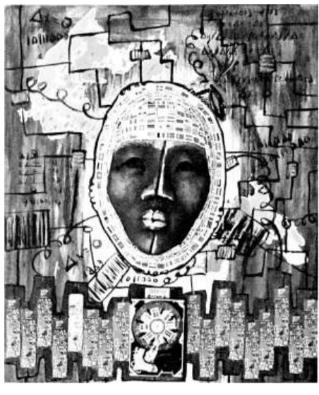
▲李寶石的油畫作品《面具和帆布的混合》

【本報訊】記者黃仰鵬東莞報導：繼「反芻——後殖民語境下的裝置陶藝展」及「中韓水墨藝術交流展」後，廣東東莞再展韓國藝術風。「二〇一〇——阿里郎在東莞——韓國藝術家李寶石作品展」正在東莞莞城美術館舉行，展出八十七件繪畫、造型藝術及裝置作品，為觀眾帶來別具特色的韓國藝術。該展覽展期至九月一日。