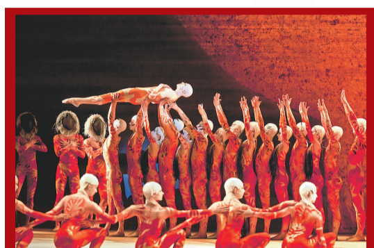
▲英國皇家芭蕾舞團演繹麥美倫版本的《春之祭》

由於麥美倫深感這個舞作呈現的祭祀儀式包含廣義的概括性，而非局限地只描述某個種族、文化或地域的情況現象，及至一九八七年「皇芭」復排