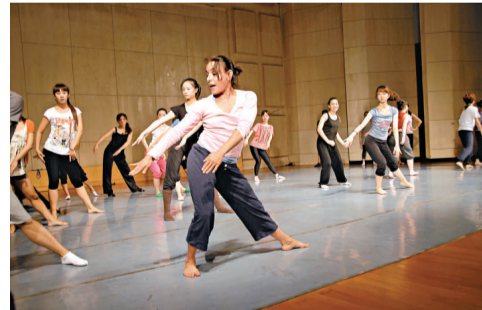
▲來自美國的國際舞蹈家在指導學員

【本報訊】記者柳海林、通訊員屈會超鄭州報導：「美國舞蹈節 (ADF) 中國·河南國際舞蹈大師班」日前在河南師範大學開課。這是美國舞蹈節繼二〇〇八年上海舉行首屆國際舞蹈大師班後再度走進中國，並首次在內陸省份開辦國際舞蹈大師班，現代舞蹈國際大師手把手傳授現代舞蹈理念和技術。