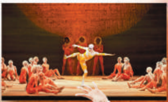
▲「皇芭」演繹《春之祭》發揮強勁凝聚力