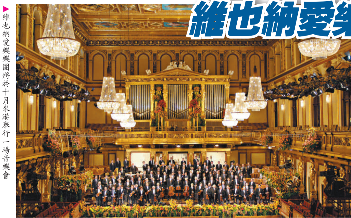
維也納愛樂樂團將於十月來港舉行一場音樂會

美國舞蹈節 (ADF) 成立於一九三三年，是世界上規模最大的現代舞專業機構，有「世界現代舞的麥加」之稱。