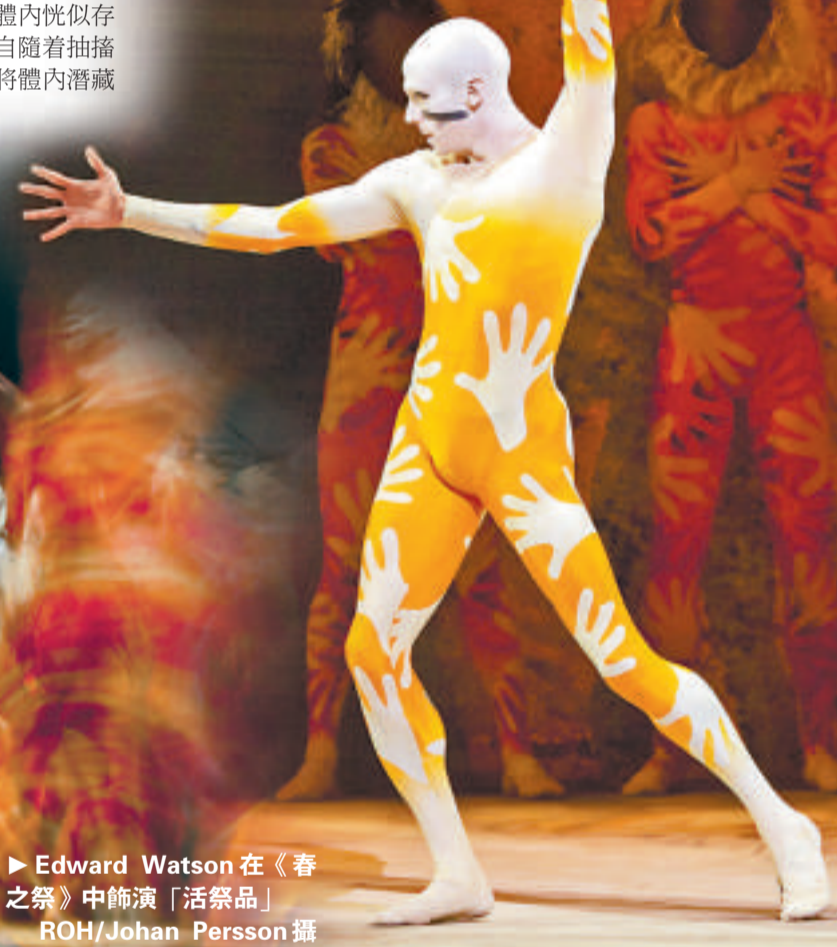
▶ Edward Watson 在《春之祭》中飾演「活祭品」