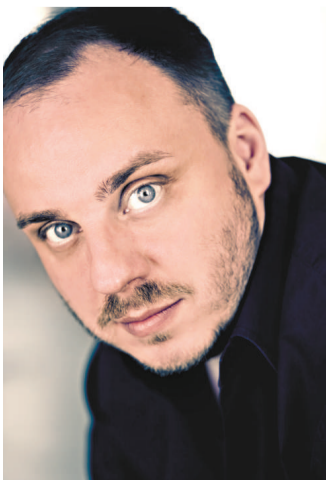
▲男中音歌唱家馬蒂亞斯·格納