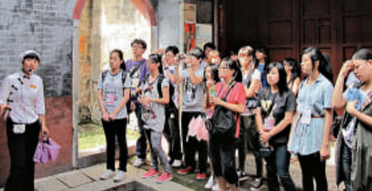
了解當地文化風情

商體驗遊學團」獲得熱烈響應，希望日後更多企業參與，使這個有意義的項目持續舉辦下去，提供更多機會讓同學參與。參與遊學團的學校及團體包括佛教何南金中學、東華三院李嘉誠中學、保良局馬錦明中學、風采中學、香海正覺蓮社佛教馬錦燦紀念英文中學、香港小童群益會（粉嶺）/明愛粉嶺陳震夏中學、基督教香港信義會太和及北區青少年綜合服務中心。