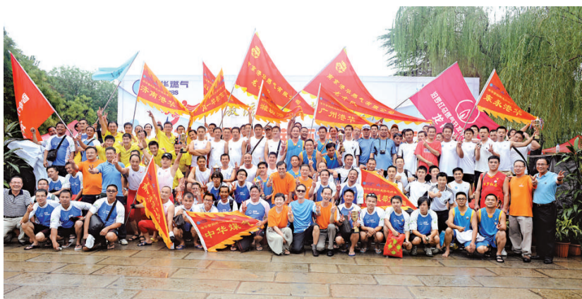
首屆港華龍舟賽後冠、亞、季軍三隊與集團領導大合影

作為國內首屈一指的城市燃氣集團，港華燃氣深明人才是集團成功之本。一直以來，港華燃氣集團非常重視員工的身心健康和個人發展，通過推行形式多樣的措施，在幫助員工提高業務技能的同時，增強企業文化創新活力和員工凝聚力。