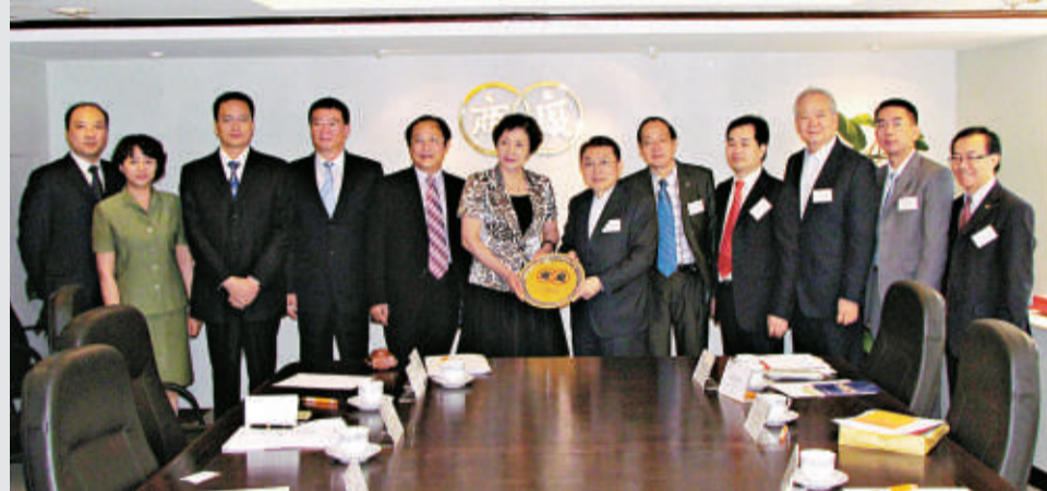
新疆維吾爾自治區代表團到訪廠商會受到熱烈歡迎

公升裝紅酒，並由大會邀得政務司司長唐英年於酒標上親筆簽名；米蘭站捐贈之「Chanel 2011 春夏系列彩色斜紋呢經典款肩背包」；另外，暗標競投之精美物品共 27 款，當中包括：愛爾蘭四人制搖滾樂隊 U2 親筆簽名電子結他；退役 NBA 球星姚明親筆簽名 NBA 籃球等。「海外學生會」的成員於過去個多月積極參與義賣活動，他們毋懼炎熱天氣，身體力行到商場、港鐵站及街頭義賣愛心環保筷子及手巾等，並於卓悅化妝品門市擔任銷售大使，義賣防曬產品等；學生會成員亦聯同「仁濟慈善大使」黎耀祥及劉心悠上門探訪獨居長者，送贈愛心福袋，並前往仁濟屬下單位「彩悠軒」探訪一群嚴重智障或嚴重肢體弱能人士，了解他們的需要；全憑學生們的愛心義賣，以及各界善長的支持，整個活動共為「仁濟傳心傳義基金」籌得 2,368,230 元的善款。「仁濟傳心傳義基金」於 2011 年 5 月 8 日成立，宗旨是幫助有經濟困難的嚴重肢體殘疾人士，應付日常照顧的需要，從而提升殘疾人士在社區獨立生活的能力，並減輕家人的負擔，為殘疾家庭帶來曙光。