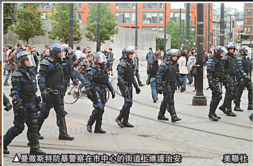
曼徹斯特防暴警察在市中心的街道上維護治安