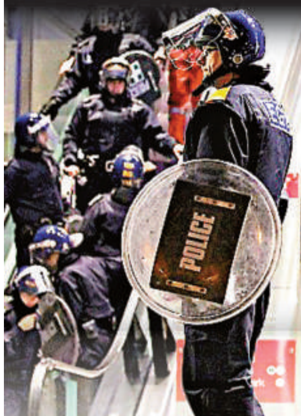
伯明翰警方在一間商場外加強巡邏