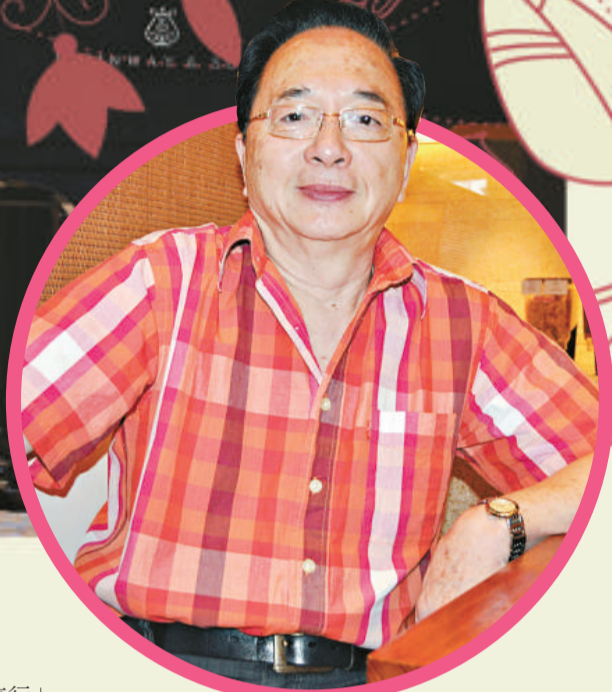
▲作曲家陳鋼說香港是他的第二故鄉