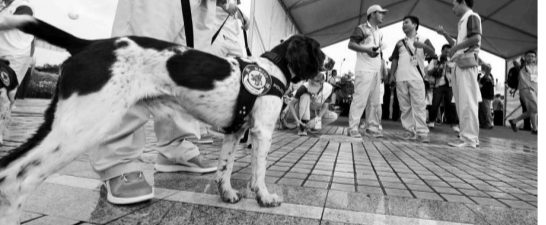
▲大運會臨近開幕，警方加強安保，防爆犬在現場進行排爆檢查

俄羅斯代表團由476名選手組成，將角逐24個大項，排第三位的是日本代表團；值得關注的是，美國派出了450名運動員，為上屆的四倍。