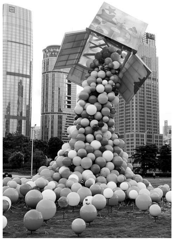
▲體現深圳城市特點和「大運」主題元素的雕塑隨處可見 新華社

量安全應急專家組，配合指導大運會期間農產品質量安全及突發事件的評估、預警、處置等工作。 深圳農業部門已投入技術力量到大運保障第一線，加強供應基地監管，重點做好運動員村的食用農產品質量安全檢測工作。為加大農產品預警監測和風險排查，深圳上半年在全市檢測農產品26萬多份，蔬菜農藥殘留合格率在98%以上，生豬「瘦肉精」和萊克多巴胺、水產品藥物檢測合格率在99%以上。針對問題隱患，共銷毀生豬300多頭，蔬菜1萬多公斤。