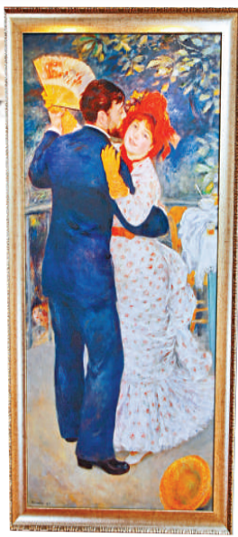
雷諾阿的《鄉間舞者》高仿品