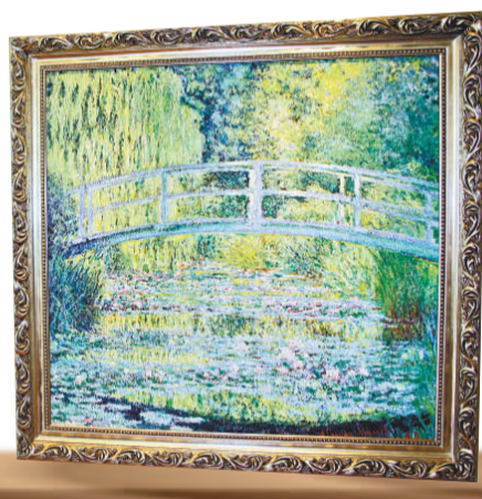
莫奈《蓮花池塘，綠色和諧》高仿品受買家歡迎