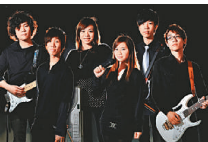
由香港浸會大學生組成的 Zpark 樂隊