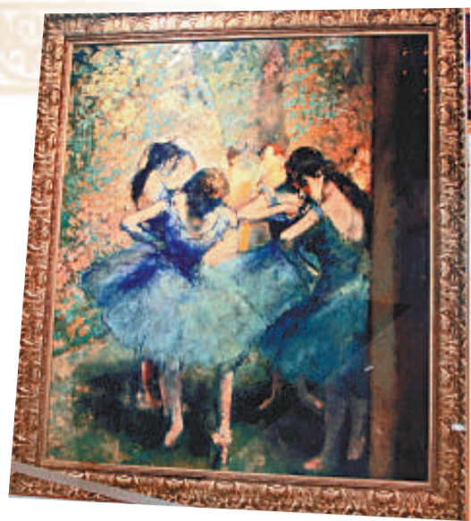
德加的《藍衣天使》高仿品