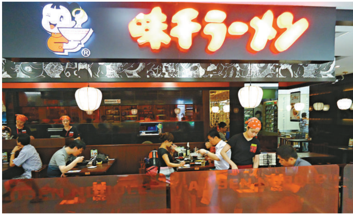
▲味千已承認拉麵的湯底為濃縮液勾兌而成，並非是熬製出來的豬骨濃湯。圖為深圳中信廣場的門店，生意亦明顯不及出事前紅火

味千方面是否有出招應對客流減少的危機？記者詢問了幾家味千拉麵的店員，他們均表示，暫時還未接到上頭有關通知，無論是菜式和價錢，暫時都沒有變動，目前一切照常。