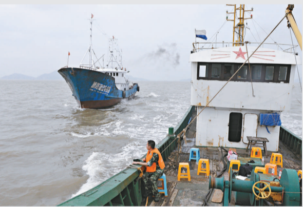
▲一艘漁船13日凌晨在浙江台州路橋劍門港外海域沉沒，導致一人死亡，六人下落不明。圖為台州救援漁船在事發海域搜救 新華社

宜興竹海風景區位於宜興市西區南31公里的湖父鎮境內，是國家4A級旅遊景區、國家風景名勝區和江蘇省級森林公園，目前正在創建國家5A級旅遊景區。景區內有二萬餘畝翠竹，號稱「中國第一竹海」。