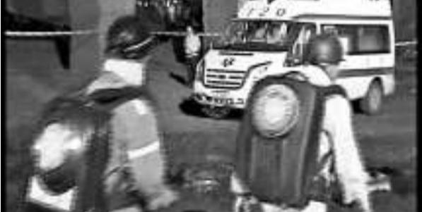
▲ 15 日，救援人員正在事故煤礦救援