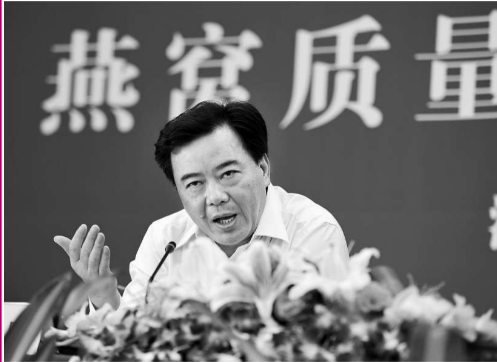
▲ 15 日，浙江省工商局局長鄭宇民在新聞發布會上回答記者的提問

目前浙江工商已經部署開展燕窩市場專項檢查行動，對各商場、超市、專營店銷售的血燕產品進行全面抽檢，並對相關血燕經銷商展開立案調查。