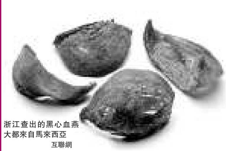
浙江查出的黑心血燕大都來自馬來西亞 互聯網

【本報訊】綜合新華社、中新社消息：燕窩是中國人喜愛的傳統保健品，近年來被傳為珍貴滋補品的「血燕」更是價格高昂。但是，這些貴價補品近期不但被發現有以劣充好造假之嫌，抽檢還發現其中的亞硝酸鹽含量嚴重超標。這些血燕產品主要進口自馬來西亞等國家。有趣的是，馬國特別派出「官員」前來闢謠，但其身份竟然也是造假。