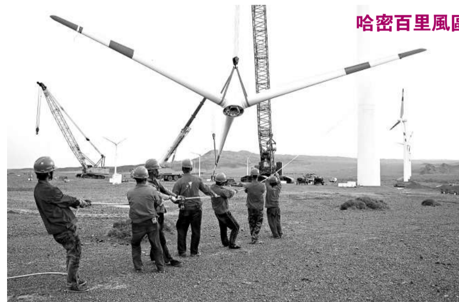
哈密百里風區風電站全面裝機

對此，公安部有關負責人表示，下一步，公安機關將積極依託社會治安綜合管理機制，與工商等各有關行政主管部門緊密協作，做好有關工作：一方面，保持對傳銷違法犯罪活動的高壓態勢，遏制傳銷的蔓延發展勢頭；另一方面，配合做好社會治安綜合管理工作，積極創建「無傳銷社區」、「無傳銷校園」；再一方面，繼續配合加強宣傳工作力度，着力增強群衆防範傳銷和抵制傳銷的意識和能力。