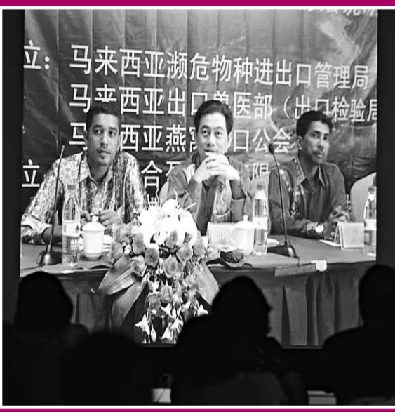
▶ 浙江省工商局在新聞發布會上播放 7 月 26 日「馬來西亞官方新聞發布會」的視頻資料，根據工商部門的調查，出席此次新聞發布會的兩個官員是冒充的