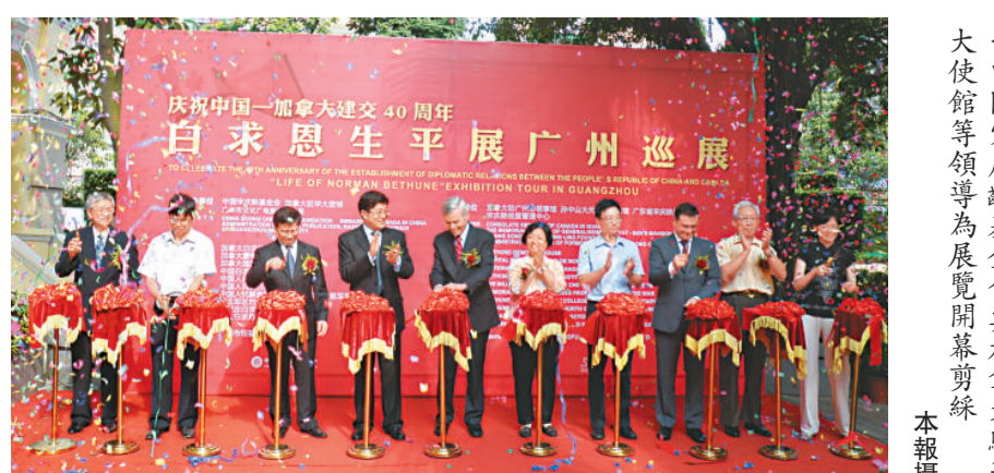
▲中國宋慶齡基金會與加拿大駐華大使館等領導為展覽開幕剪綵