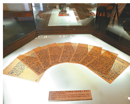
▲宋慶齡為《白求恩大夫的故事：外科解剖刀就是劍》一書撰寫的序的英文手稿

二〇〇九年中華人民共和國建國六十周年之際，中國國際廣播電台發起並聯合中國人民對外友好協會和國家外國專家局共同主辦「中國緣·十大國際友人」網絡評選活動，白求恩以四百多萬選票名列榜首。在北京人民大會堂舉行的頒獎禮上，加拿大駐華大使馬大維代表加拿大人民和白求恩的家屬從中共中