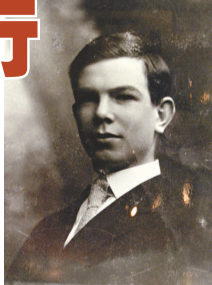
▲青年時期的白求恩像