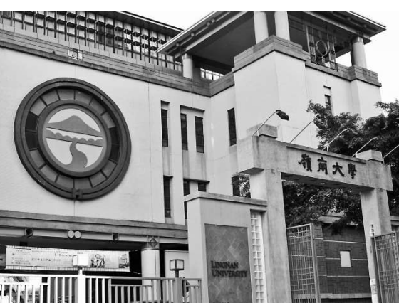
位於屯門青山公路的嶺南大學

一九五二年，全國高等院校進行調整，嶺南大學解體，校園讓給中山大學。到了一九六七年，嶺南校友在香港復校，使用司徒拔道的嶺南中學課室上課，時稱「嶺南書院」。一九九五年該校遷入屯門，四年後升格為大學。校園設計參考廣州嶺南大學的中軸線對稱布局，大樓間由迴廊及庭園組成，融合中西古今。