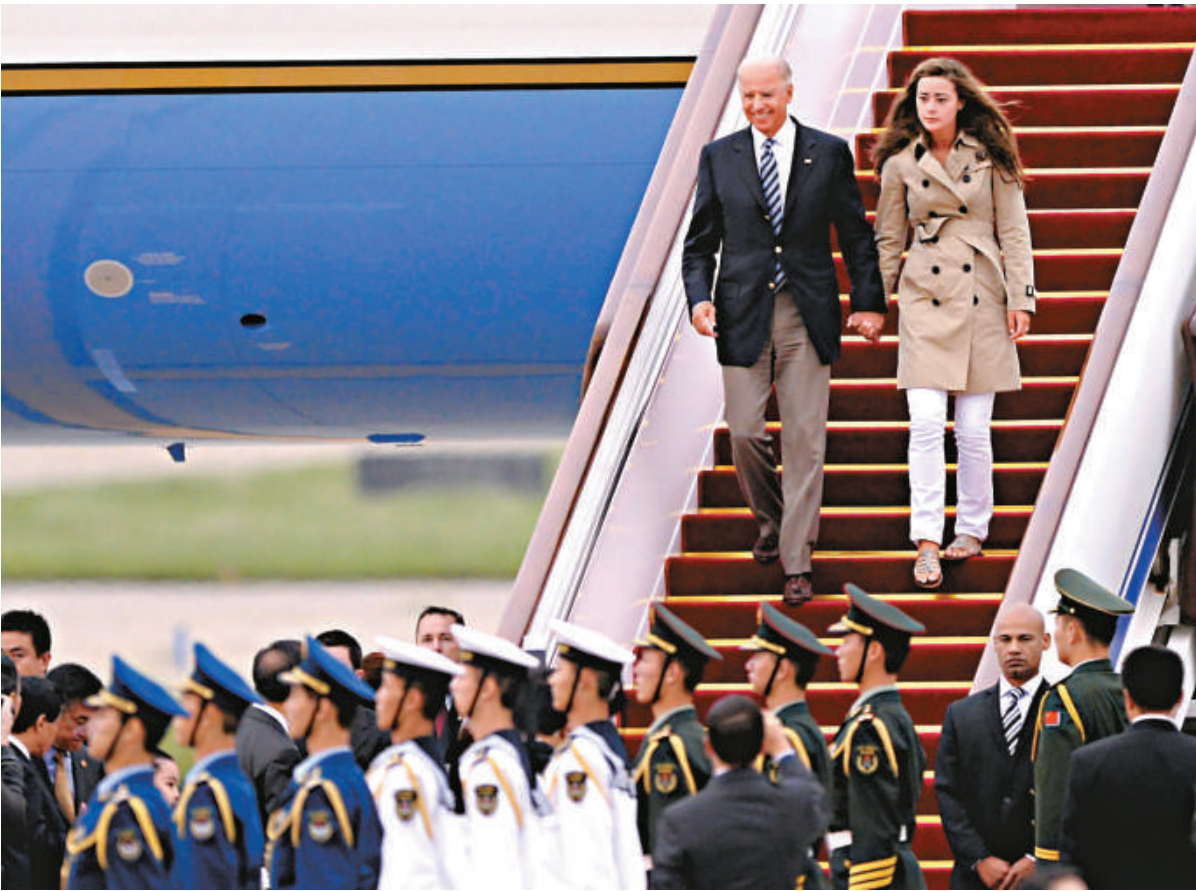
▲ 17 日傍晚，美國副總統拜登抵達北京首都國際機場，開始對中國進行正式訪問。這是拜登和他的孫女走下飛機

而中方官員對拜登今次訪問的態度則較為低調。這一方面是因為中共十八大在明年秋季才會舉行，另一方面，中方也想今次拜登訪華能夠成功，從而為習近平訪美創造良好的輿論環境。但從目前媒體關注的熱點問題來看，中美卻極有可能在今次訪問中再次爭吵。因為無論是對台軍售還是美債問題，美方很難做出令中方滿意的保證。中國外交部在報名採訪的數百家中外媒體中，只選擇了 20 家媒體現場採訪，這與奧巴馬訪華時的高調截然不同。此外，中方也沒有在訪問前安排吹風會介紹情況。