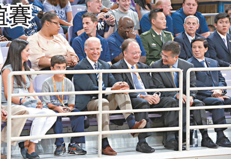
◀ 17 日傍晚，拜登抵京後即赴北京奧林匹克體育中心，觀看中美籃球友誼賽

帕內塔說：「我們有日漸崛起的力量和國家，比如中國、印度和巴西，更不用說俄羅斯了。我們必須繼續依靠他們為全球穩定發揮作用。我們面臨資源有限的問