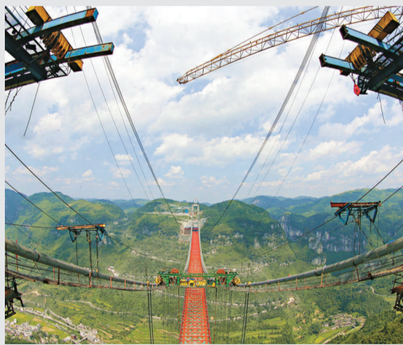
▲二十日，湘西矮寨大橋合龍

【本報實習記者唐竟淳吉首二十日電】20日上午，隨著最後一顆鉚釘裝嵌到位，被譽為「世界峽谷跨徑最大鋼桁樑懸索橋」的湖南湘西矮寨大橋的鋼桁樑合龍。