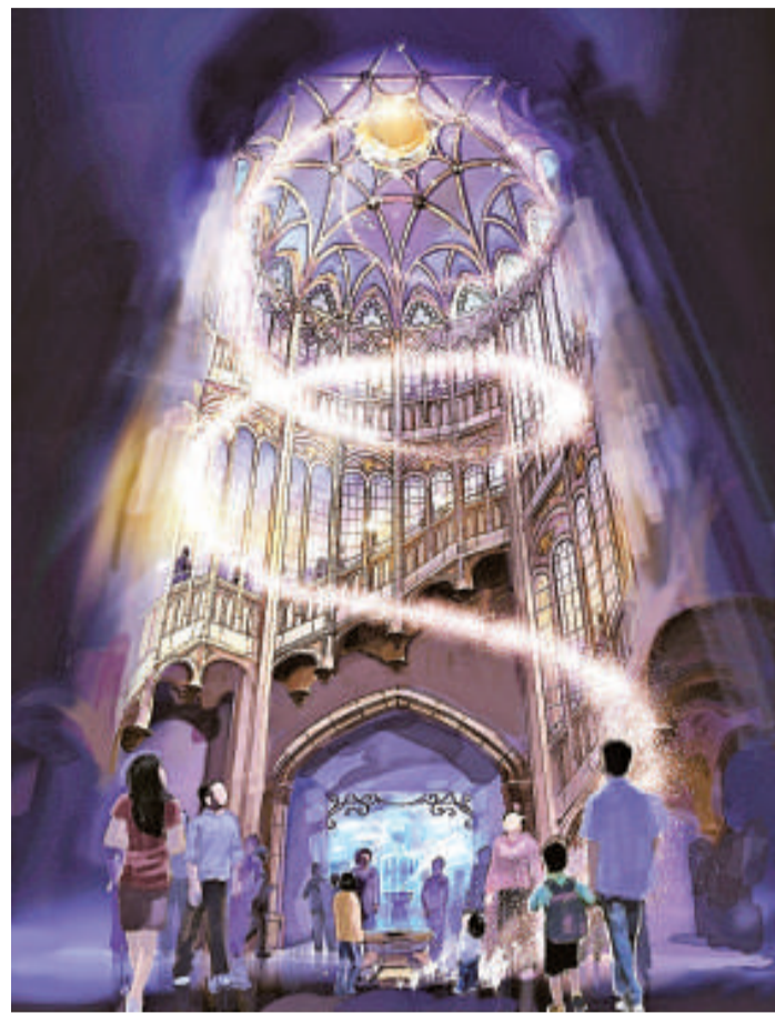
▼滬迪園遊客可坐船進入迪士尼城堡 網絡圖片