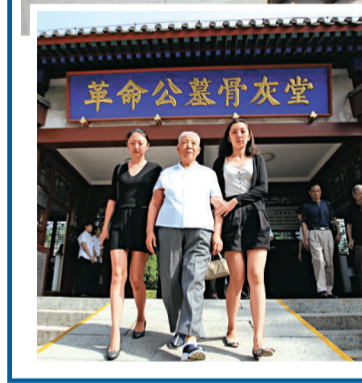
▲二十日，在前中共領導人華國鋒家鄉山西呂梁交城縣，民眾自發趕到呂梁英雄廣場，紀念華國鋒逝世三周年 中新社 ▲二十日，華國鋒夫人韓芝俊率子女在北京八寶山公墓紀念華國鋒逝世三周年 中新社