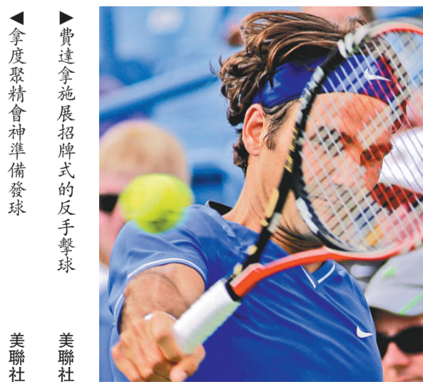
▲拿度聚精會神準備發球