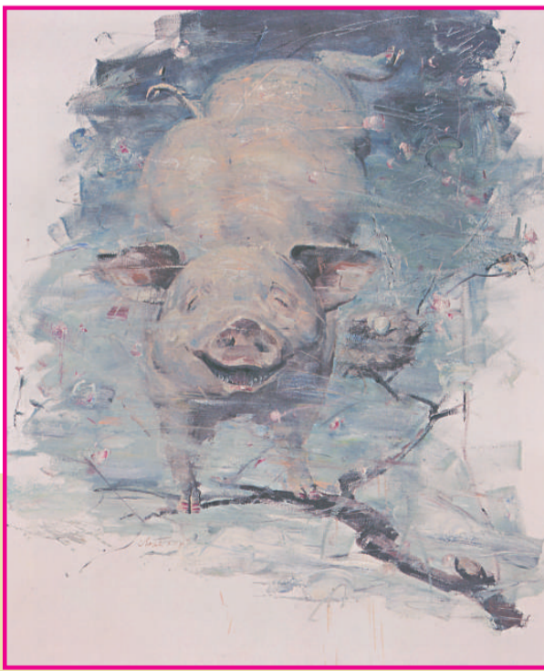
《樹上豬》 (布畫油畫) 馮碩