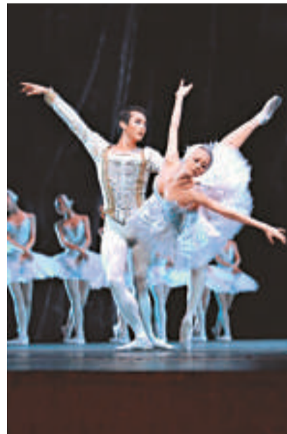
▲中國國家芭蕾舞團演出《天鵝湖》劇照