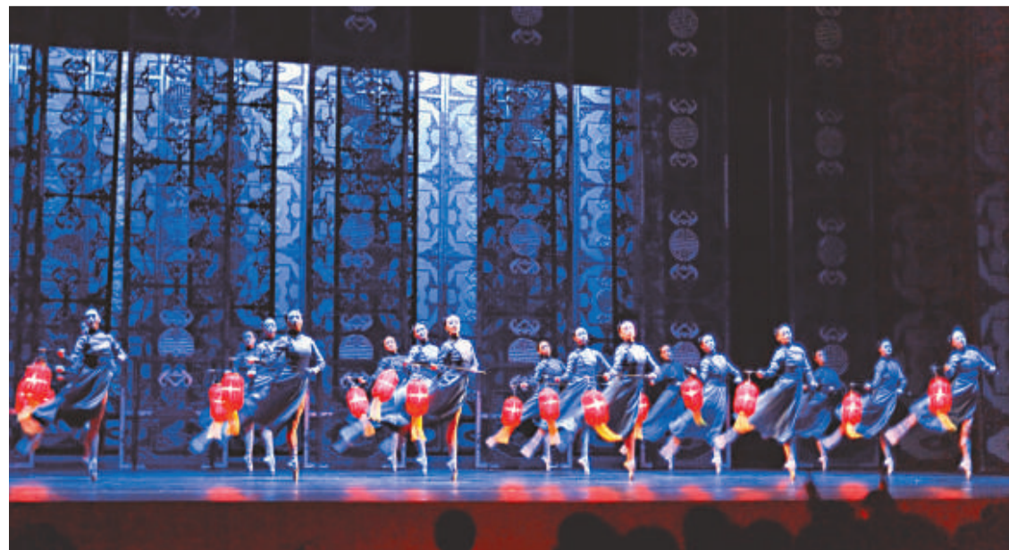
▲中國國家芭蕾舞團演出《大紅燈籠高高掛》劇照

「世界文化藝術節2011——游藝亞洲」由康樂及文化事務署主辦，門票於城市電腦售票網發售。節目查詢可電二七〇一〇四四。