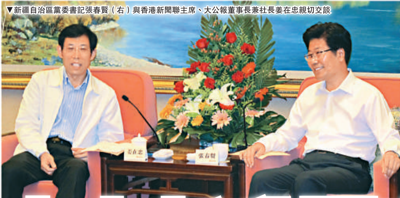
▼新疆自治區黨委書記張春賢(右)與香港新聞聯席主席、大公報董事長兼社長姜在忠親切交談