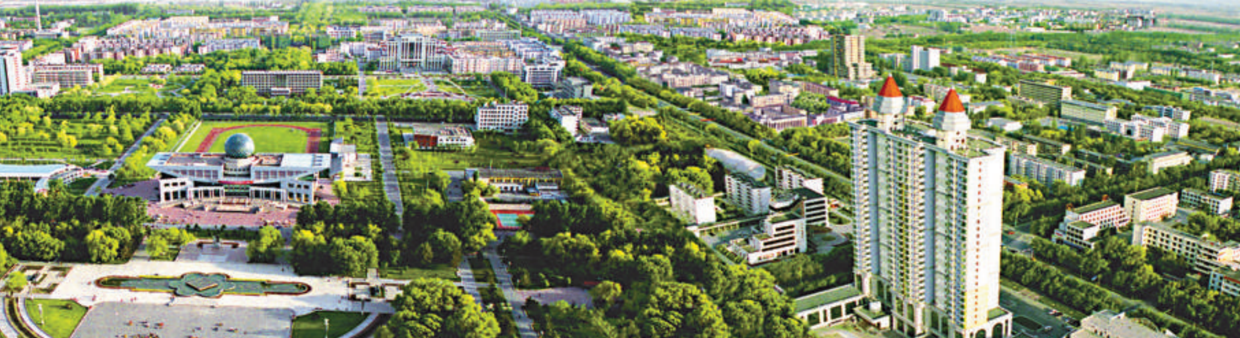
▲戈壁明珠石河子鳥瞰