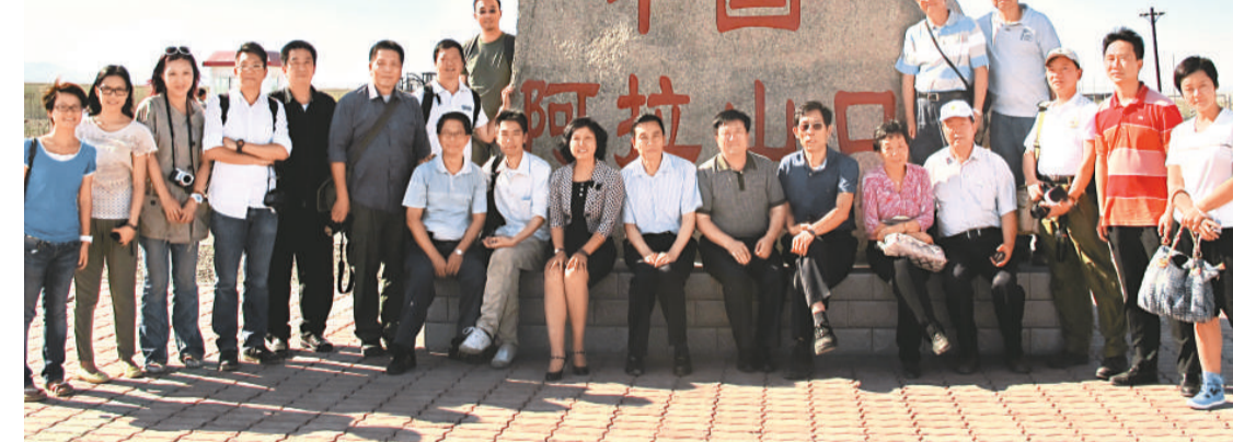
▲採訪團在中國過貨量最大的陸路口岸——阿拉山口口岸採訪合影