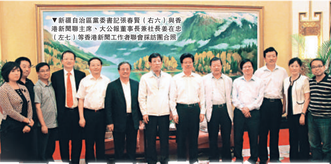
▼新疆自治區黨委書記張春賢(右六)與香港新聞聯席主席、大公報董事長兼社長姜在忠(左七)等香港新聞工作者聯誼會採訪團合照