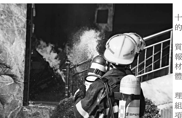
▲事故發生時火焰不小，引燃裝修用的聚氨酯建築材料。這種材料一旦燃燒就會產生含有劇毒氰化氫的氣體

【本報記者黃裕勇三水二十四日電】據認為是佛山十五年來最嚴重安全事故的「8·23」火災，16名死傷者的家屬已趕到三水，賠償工作正在洽洽中。 據悉，發生火災的三水盛豐陶器廠地屬於耕地性質，屬於非法用地建設，工廠建築沒有向當地消防部門報批。經初步調查，廠房中用了易燃可燃的聚氨酯建築材料，一旦燃燒就會產生含有劇毒氰化氫的氣體，本次火災大量死者因此窒息而死。 火災發生後，三水區區長劉東豪率領成立了協調處理領導小組，下設善後處理組、醫療救護組、事故處理組、現場維護組等6個工作組和辦公室，按照分工開展各項善後處置工作。