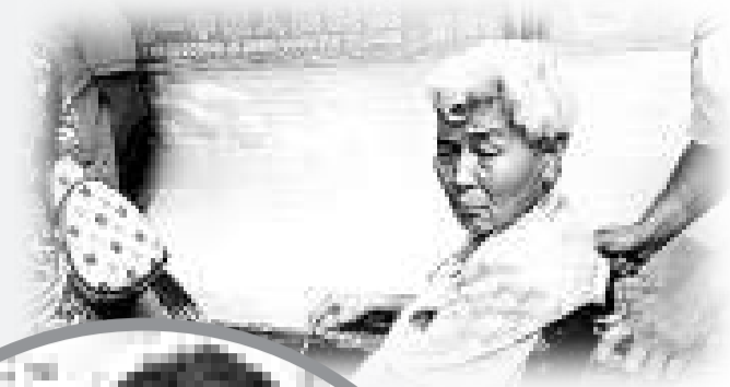
▲庭審前王老太情緒激動，一度放聲痛哭

天津社科院輿情專家陳月生說，法院遇到這種各執一詞又沒有證據的案件，在審判時要慎之又慎，在事實真相無法判斷的情況下，在依法作出審慎判決同時，還必須對判決的理由進行合乎法理的詳細闡釋，不能讓公眾產生太多質疑，避免因為判決本身的含糊其辭或其他錯誤造成輿論的質疑。