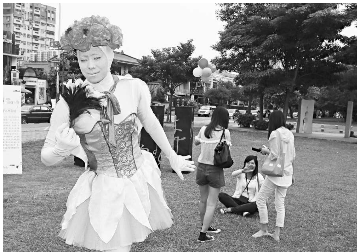
▲台灣觀光局24日在台中草悟道舉行「中區國際光點計劃」啟動儀式，邀請街頭藝人表演，展現在地人文特色 中央社

蔡英文的競選總部已選定新北市板橋區文化路和新府路交叉點，該址「剛巧」是2008年「馬蕭配」贏得大選的競選總部。據報道，蔡英文請了島內名風水師翁三雄指點風水。據翁三雄的專業意見稱，該址因面向八線幹道的板橋區文化路、板橋車站與萬坪都會公園，取其噴水池明亮開闊、人氣鼎盛、風水起形勢，再加上周邊高樓林立，形成風場，輔以總部樓前豎起風車發電，既彰顯環保、乾淨能源訴求，又營造出如「香爐插香」的「眾神朝拜」格局，能有助蔡英文的「王者之勢」，使她如虎添翼。