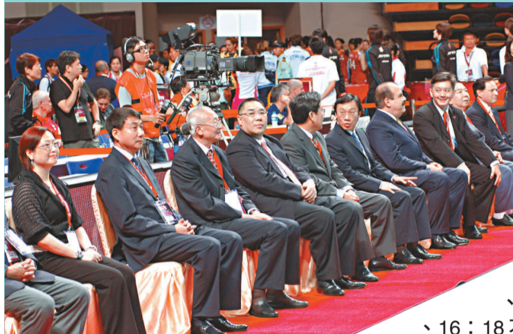
▲澳門特首崔世安(左四)和國際排聯主席魏紀中(左三)昨晚出席世界女排大獎賽總決賽開幕式。

【本報記者潘彥韜澳門二十四日電】2011世界女排大獎賽總決賽首日的煞科戰便出現五局激戰，中國今晚在A組與塞爾維亞激戰至決勝局，並打至三次平分後，終以25:20、18:25、25:23、16:25、16:18不敵塞爾維亞，把與該隊對戰的連敗紀錄增至3場。(now631台明早11時直播周四賽事)