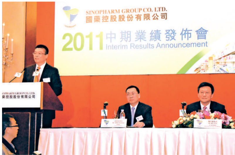
▲國藥控股中期業績發布會

受中報業績提振，該股昨日收報19.40港元，漲15.75%。中報顯示，上半年實現淨利潤7.84億元，同比增加22.88%；每股盈利0.34元，同比增加21.43%；不派中期股息。