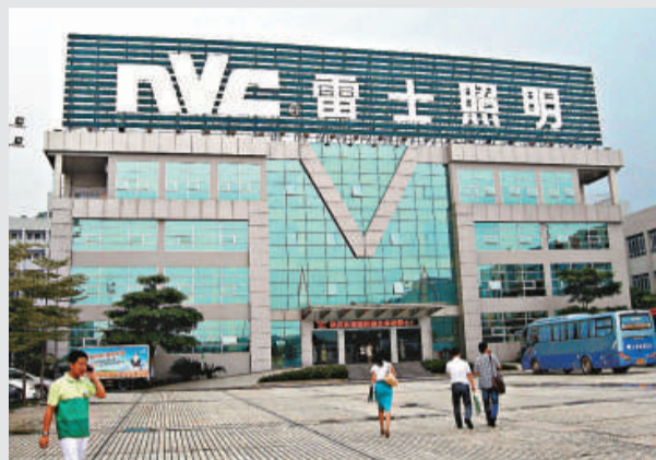
▲雷士照明加速LED照明民用化

目前，雷士已在40多個國家和地區建立起雷士品牌產品銷售渠道。雷士計劃在亞洲市場的沙特、柬埔寨、緬甸、印度等4個國家新增5個專賣店和30家經銷店。